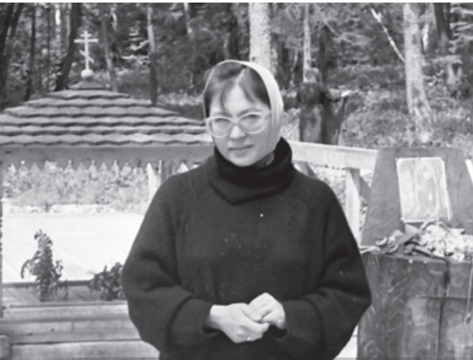
На источнике Преподобного Тихона Калужского