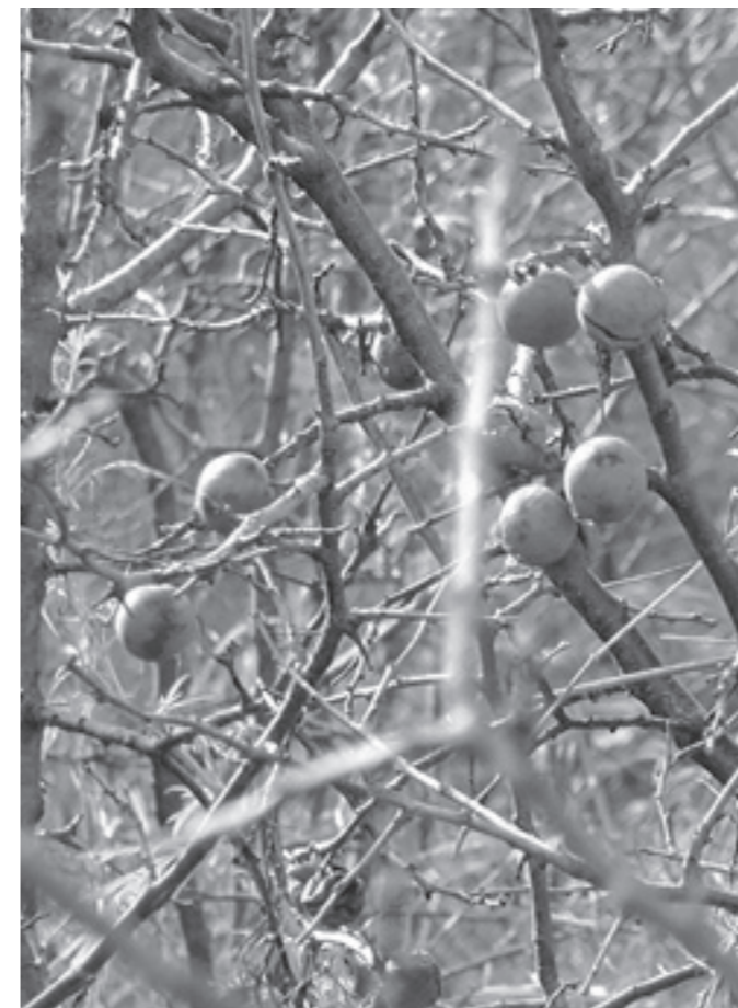
Ветви и плоды терна

ТЕРН, ТЕРНИЕ, ТЕРНОВЫЙ КУСТ. Под собирательным названием «терновник» скрываются около 200 различных колючих растений, произрастающих на Святой Земле. Тёрн, или терновник, – небольшой колючий кустарник, который, разрастаясь, образует густые и непроходимые заросли. По мнению толкователей Священного Писания, горящий терновый куст, из которого с Моисеем разговаривал Бог, принадлежал к одному из видов мимозы или акации (Исх. 3, 2): «По исполнении сорока лет явился ему (Моисею) в пустыне горы Синая Ангел Господень в пламени тернового куста» (Деян. 7, 30,35). Возможно, что библейским терновником был ясенец белый, который назван купиной. Это растение выделяет пары эфирного масла, которые вспыхивают от поднесенного огня или молнии, но сам куст при этом не загорается. Горящая, но не сгораемая купина прообразовала Деву Богородицу. Нынешние монахи Синайского монастыря св. Екатерины показывают паломникам купину.