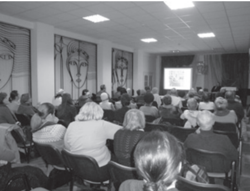
Кинолекторий «Истории Отечества страницы» на тему: «Чудотворные иконы Пресвятой Богородицы Святой Горы Афон»