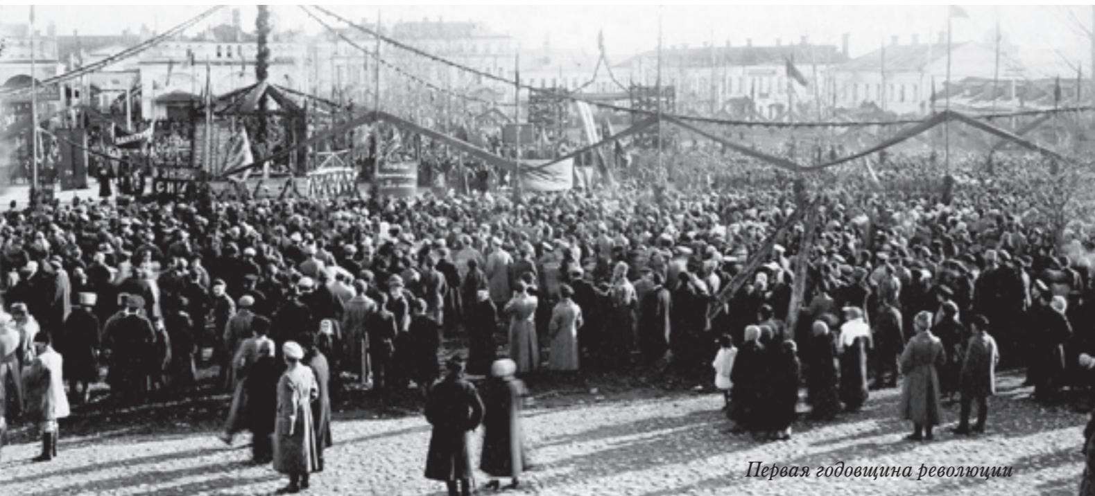
Первая годовщина революции