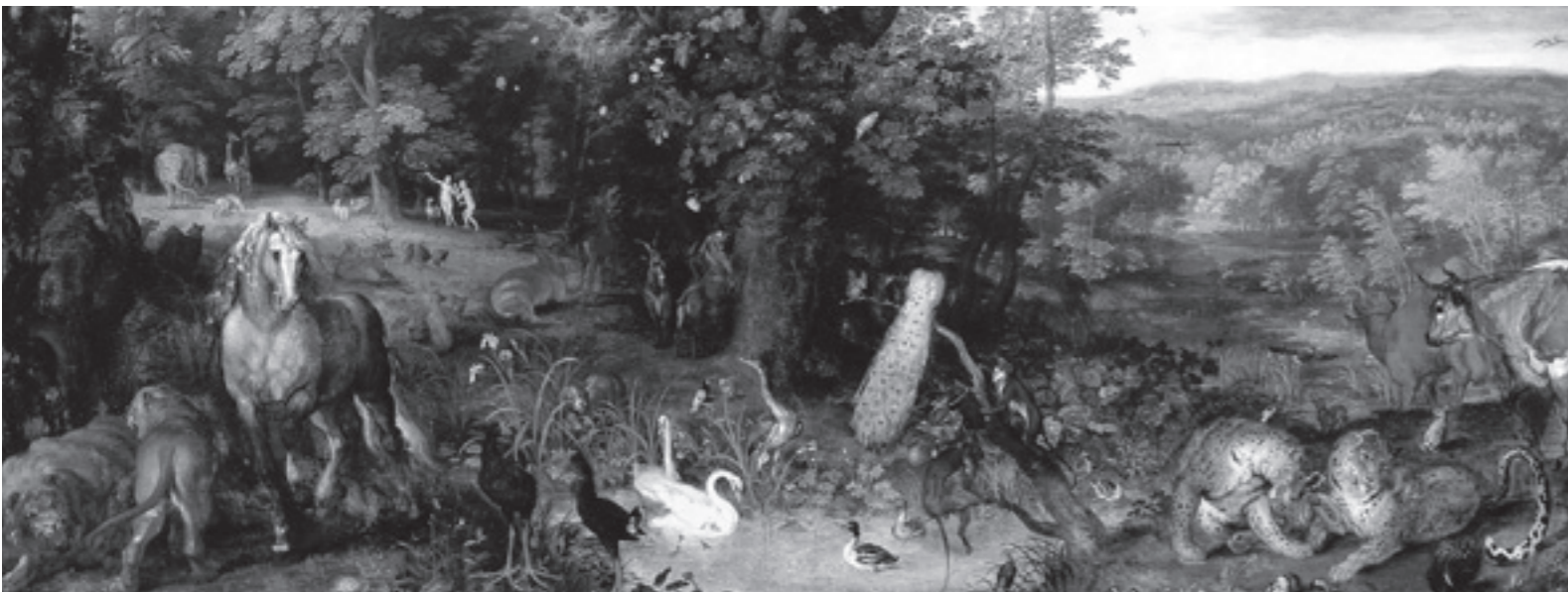
Эдемский сад. Ян Брейгель (фрагмент)