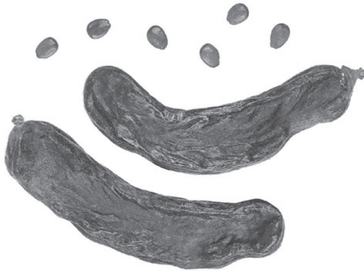
Плоды и семена рожкового дерева

СМИРНА , или МИРРА – растение, из которого получают смолу – мирру. На территории Древнего Востока, от Индии до Египта, были известны душистые смолы разных кустов, среди которых на первом месте стоит смирновый куст. Благовонная смола этого куста, называемая также миррой, была равноценна золоту, алмазу, жемчугу. Смирну использовали для курений, в спальнях богатых