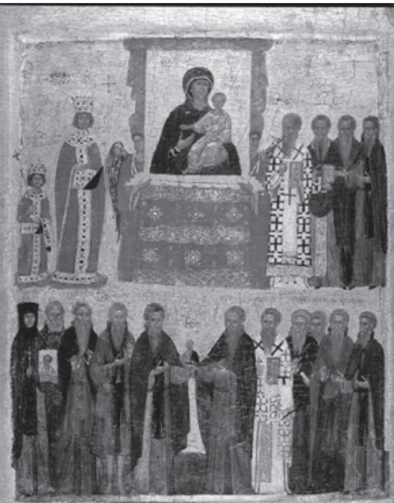
Икона «Торжество Православия»

Божественная истина вочеловечилась, чтоб спасти Собою нас, погибших от принятия и усвоения убийственной лжи. Если пребудете в слове Моем, – вещает она, – то вы истинно Мои ученики и познаете истину, и истина сделает вас свободными (Ин. 8: 31-32)».