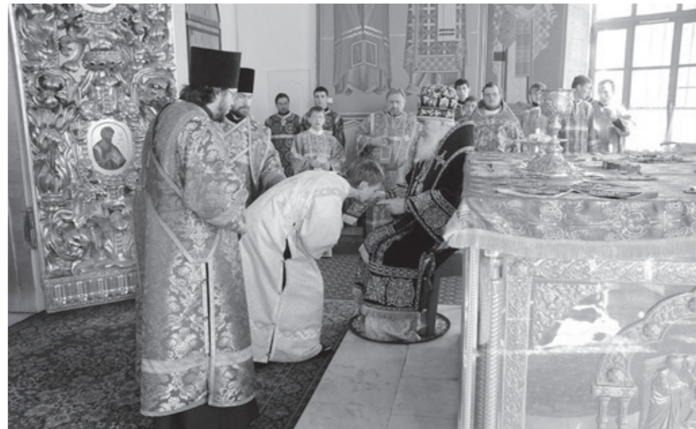
Свято-Троицкий кафедральный собор, 20 марта 2016 г.

«Первое воскресенье Великого поста именуется Неделью Торжества Православия. Этот праздник установлен в IX веке в честь преодоления ереси иконоборчества, когда в Православной Церкви было утверждено иконопочитание. Он называется «торжеством», потому что закончился сложный период борьбы с ересями. Православие одержало победу над неправославием. В Церкви установлено истинное богопознание и богопочитание. Путь Православия – путь следования за Христом и со Христом. В Православии человек получает радость не внешнюю, а радость души от общения с Богом. Именно она отличает настоящих христиан, подавая силы противостоять соблазнам мира сего, преодолевать трудности повседневной жизни».