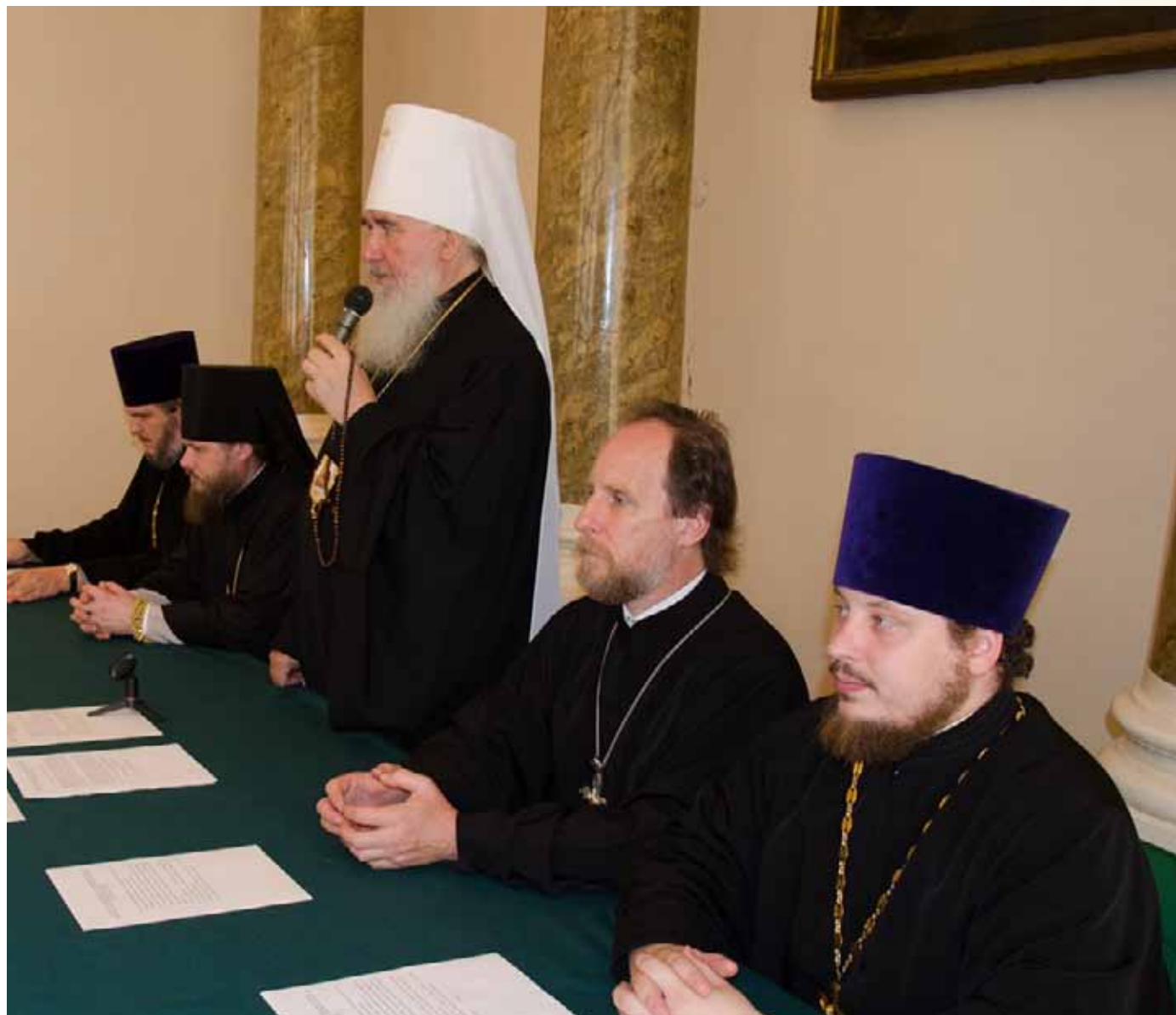
Митрополит Климент (Капалин)

Имеет более 100 публикаций в богословских и научных журналах, а также в электронных СМИ на церковно-исторические, просветительские, духовно-нравственные, социальные темы.