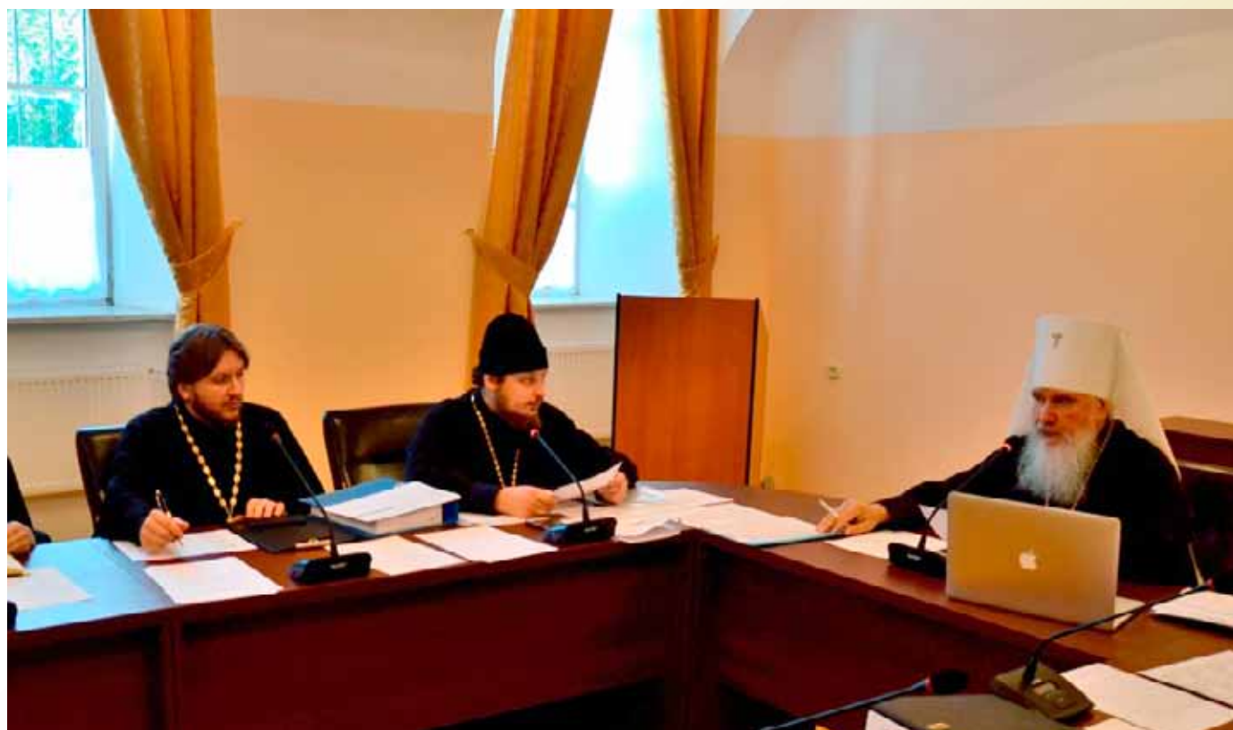
Заседание ученого совета Калужской духовной семинарии

О плане проведения научно-учебных мероприятий в Калужской семинарии на 2016/2017