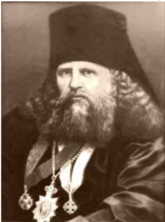
Епископ Мисаил (Крылов)

20 февраля 1883 года хиротонисан во епископа Можайского, викария Московской епархии. С 4 мая 1885 года – епископ Дмитровский, викарий той же епархии.