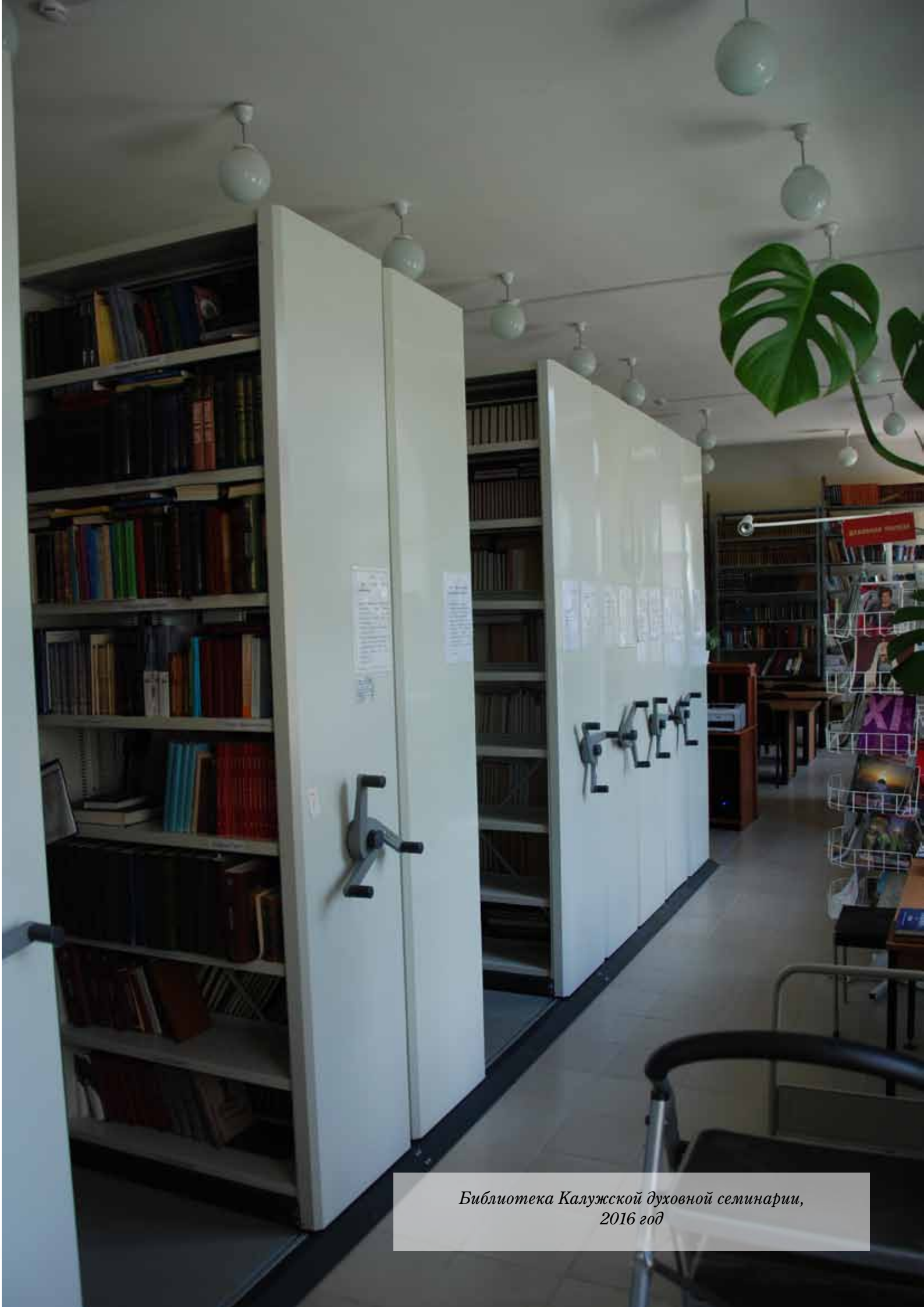
Библиотека Калужской духовной семинарии, 2016 год