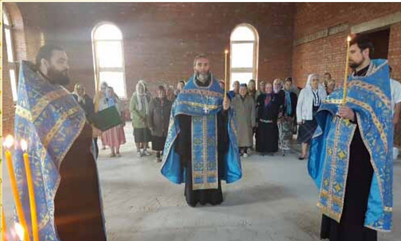
Молебен в строящемся храме в селе Головтеево Малоярославецкого района

Владыка поздравил всех учащихся и учащихся с началом нового учебного года, отдельно обратившись к первоклассникам: «Вы только делаете первый шаг в мир знаний. Годы вашего обучения пройдут незаметно, постарайтесь не лениться, больше читать, слушать своих родителей и преподавателей».