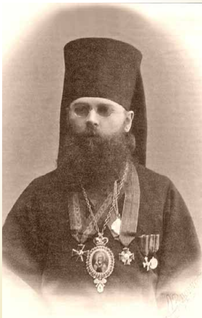
Епископ Никодим (Кононов)

С 9 января 1911 года – епископ Рыльский, второй викарий Курской епархии. С 15 ноября 1913 го-