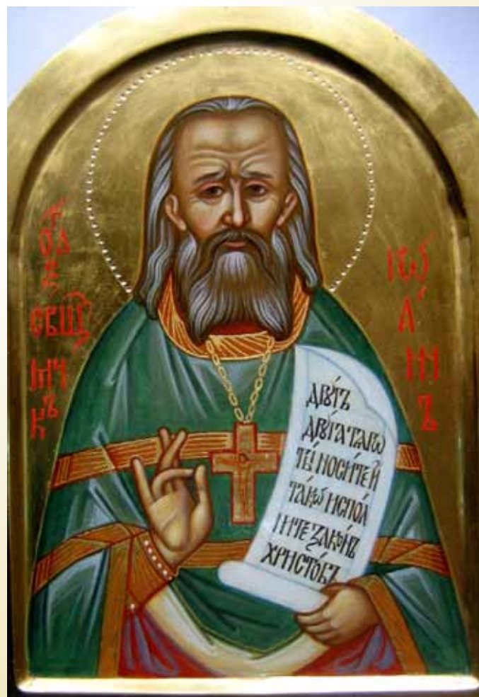
Священномученик Иоанн (Сперанский)

Путь служения Церкви священномученика Сергия (Покровского) начался позже, чем у священномученика Иоанна (Сперанского). Отец Иоанн закончил КДС в 1884 году, а отец Сергей в 1904 году. Между окончанием семинарии и рукоположением отца Сергия было несколько лет, когда заблуждения несколько отдалили его от того, к чему он стремился в семинарии. Но он преодолел пагубные заблуждения, раскаявшись в них. В 1907 году Сергей Николаевич Покровский был ру-