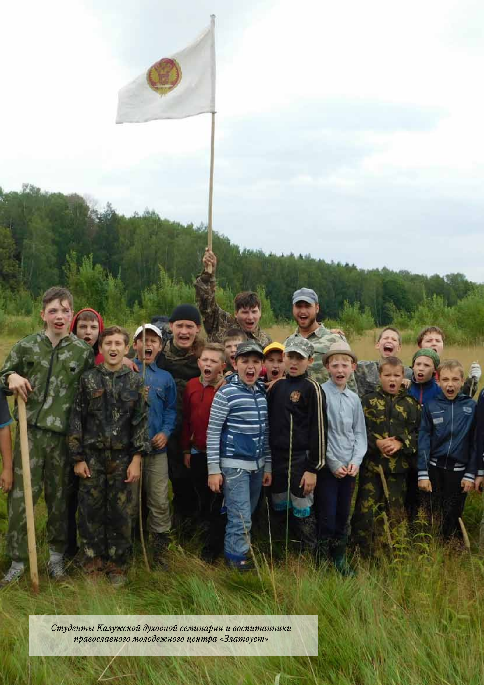
Студенты Калужской духовной семинарии и воспитанники православного молодежного центра «Златоуст»