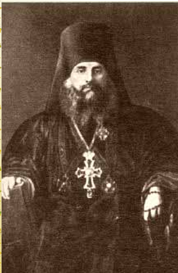
Епископ Израиль (Лукин)

1 января 1832 года рукоположен во иеромонаха, 8 января назначен библиотекарем, а 6 февраля того же года – инспектором Курской духовной семинарии.