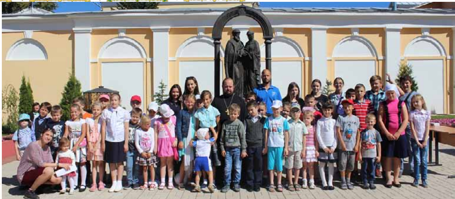
Участники акции «Помоги собраться в школу»