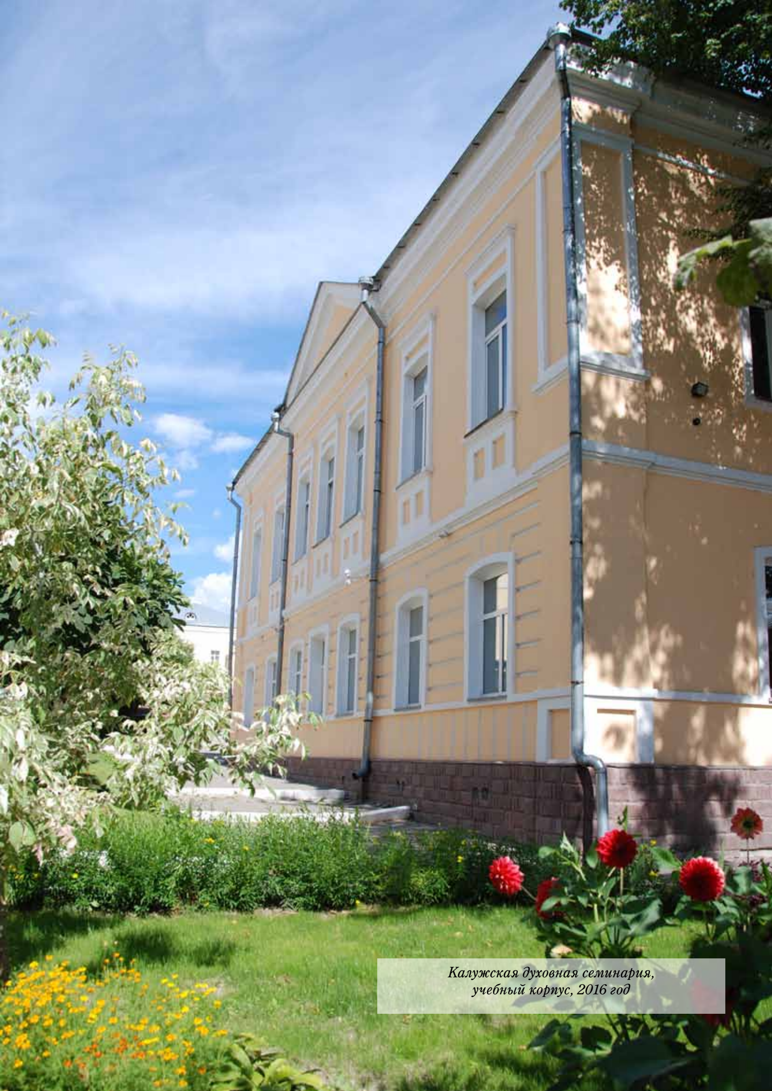
Калужская духовная семинария, учебный корпус, 2016 год