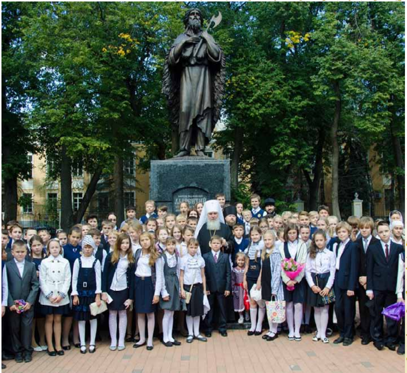
После молебна на начало учебного года в Калужском Свято-Троицком соборе

Затем возле памятника праведному Лаврентию Калужскому воспитанники православной гимназии сделали памятные фотографии с митрополитом Калужским и Боровским Климентом и епископом Тарусским Серафимом.