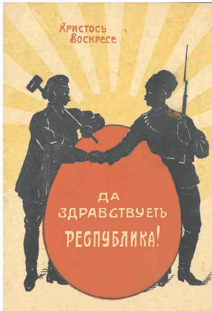
Пасхальная открытка 1917 г.

Почти через сто лет пророчество поэта сбылось в самых худших проявлениях российской действительности, «когда на брата брат поднялся». Весной 1917 года облака, заслонившие свет, только начали темнеть и пре-