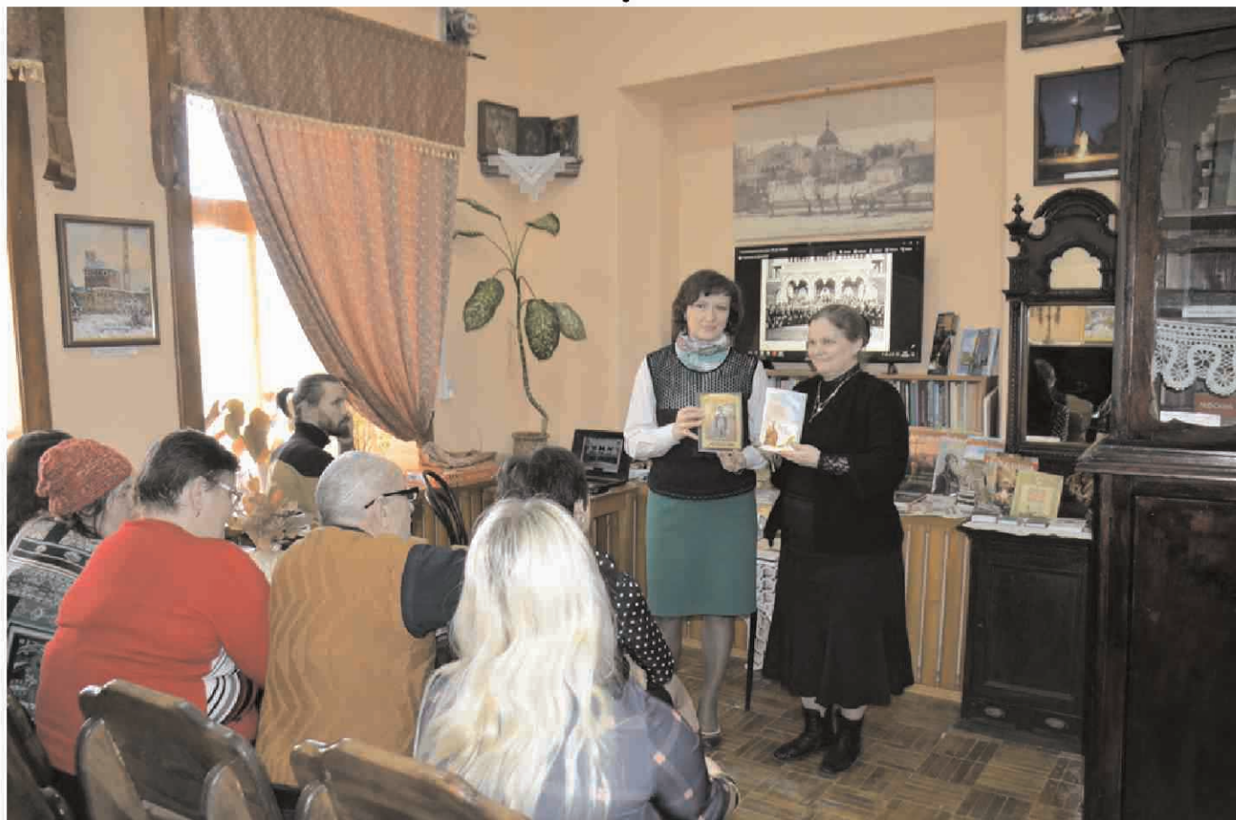
Заседание членов краеведческого клуба в районном музее Дзержинского района Калужской области в г. Кондрово