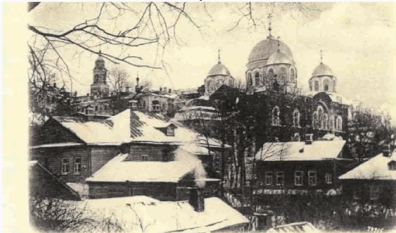
Казанский женский монастырь.

ренно. Во всем послушна. Показательно ведет монашескую жизнь. Вполне достойна пострига в мантию».