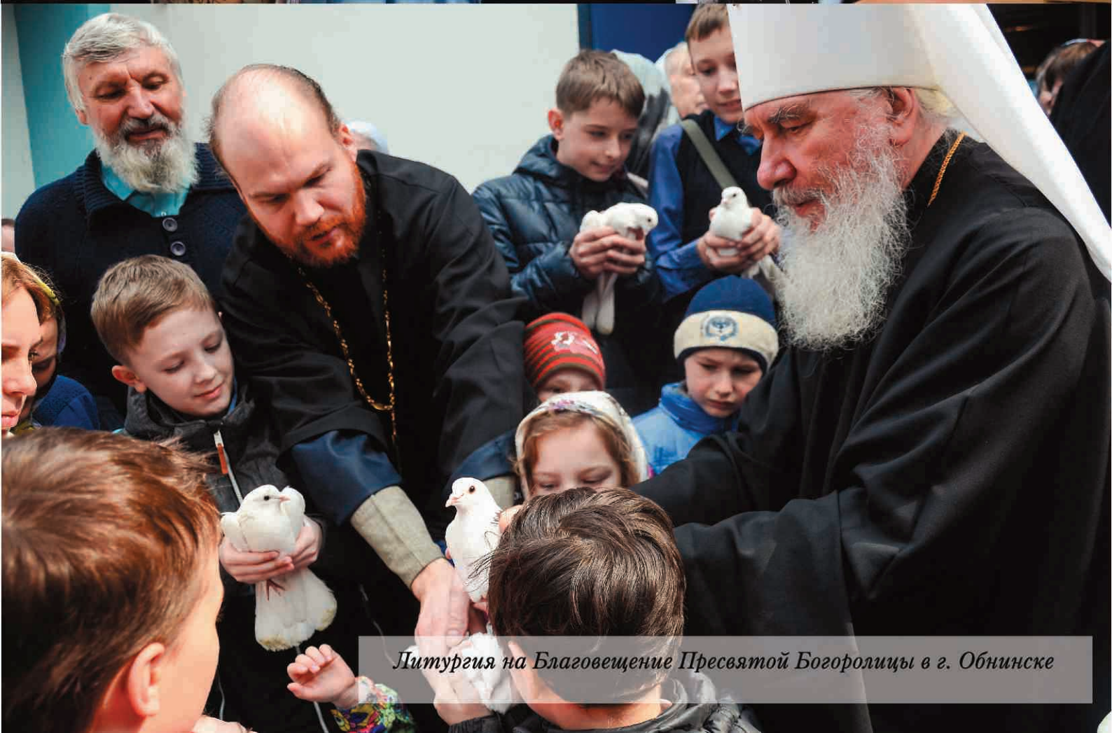
Литургия на Благовещение Пресвятой Богородицы в г. Обнинске