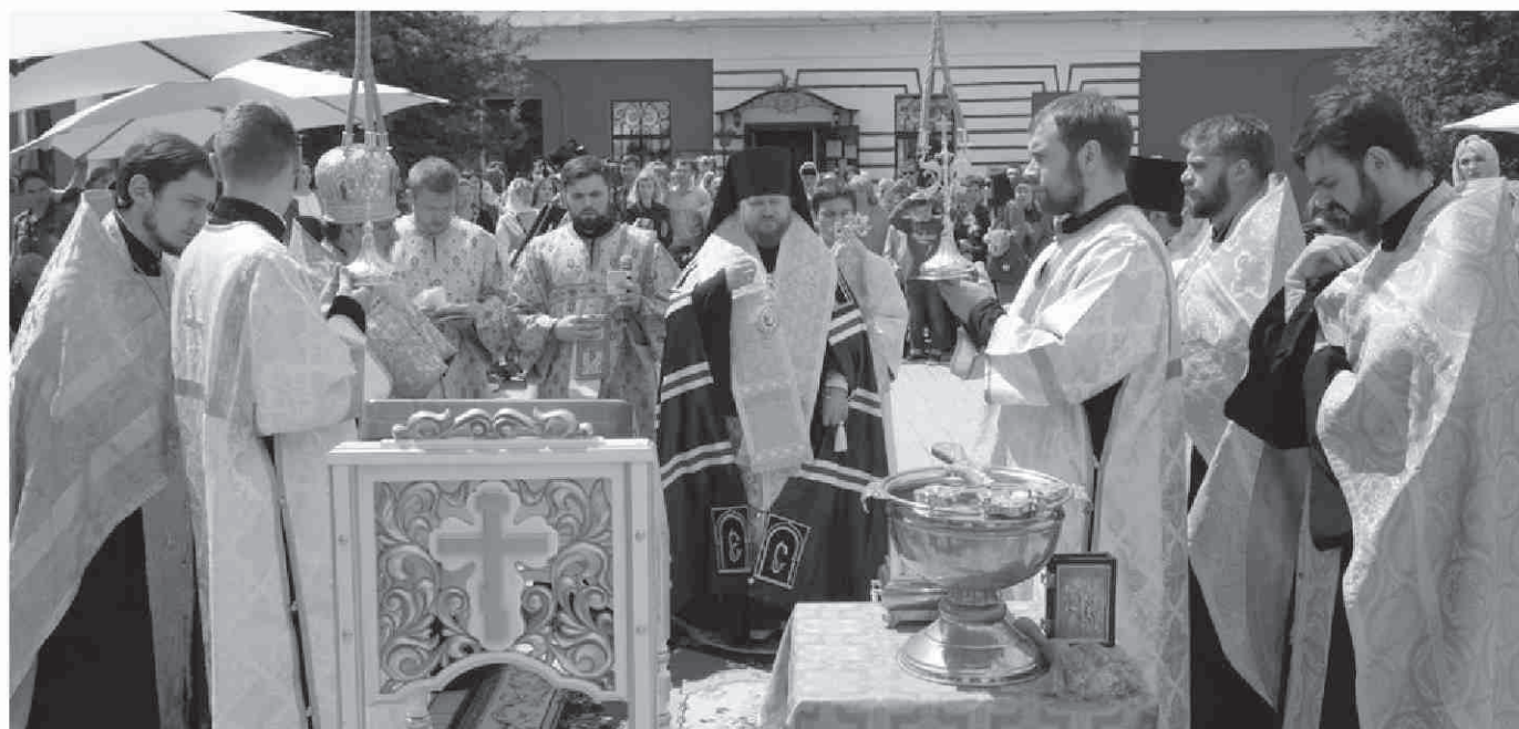
Торжества, посвященные Дню семьи, любви и верности, у памятника святым Петру и Февронии в Калуге