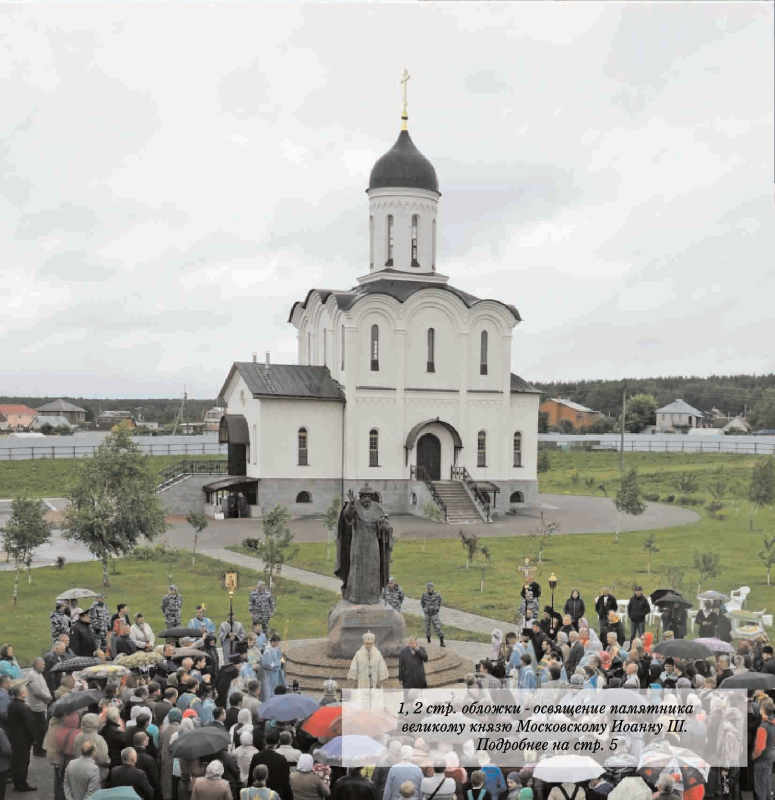
1, 2 стр. обложки - освящение памятника великому князю Московскому Иоанну III. Подробнее на стр. 5