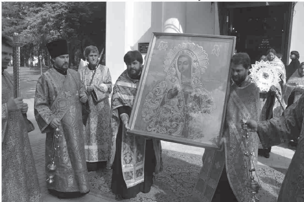
Крестный ход с Калужской иконой Пресвятой Богородицы у стен Свято-Троицкого кафедрального собора