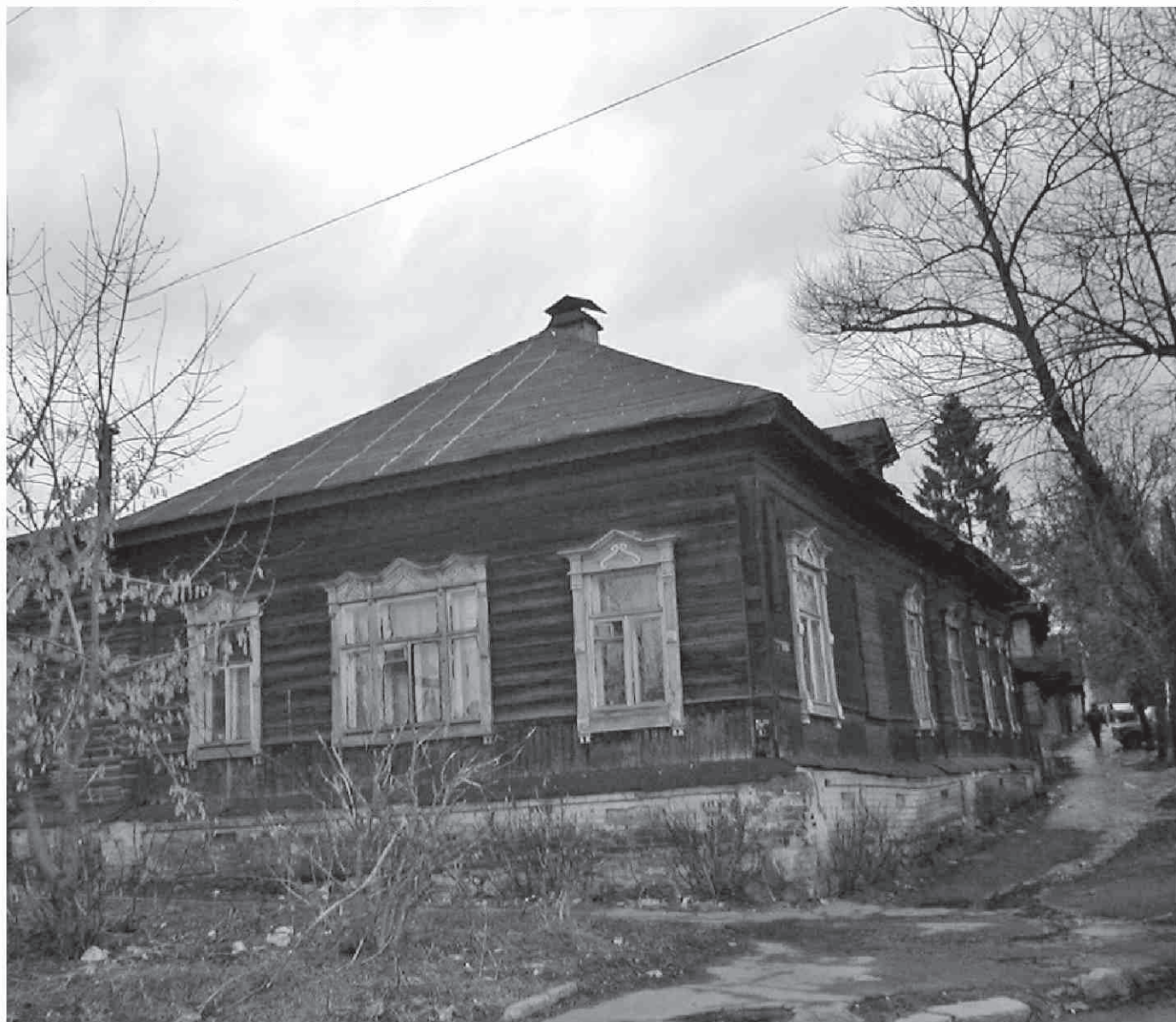
Современный вид дома, где жил свщ.мч. Августин (Беляев)

Дочь никогда не страдала от недостатка его внимания, несмотря на то, что сложно и напряженно протекало служение владыки на Калужской кафедре в это время. Строчки, в которых она через много лет оценивает отцовскую любовь, полны теплого чувства благодарности: «Папа!.. У него была добрая и какая-то застенчивая