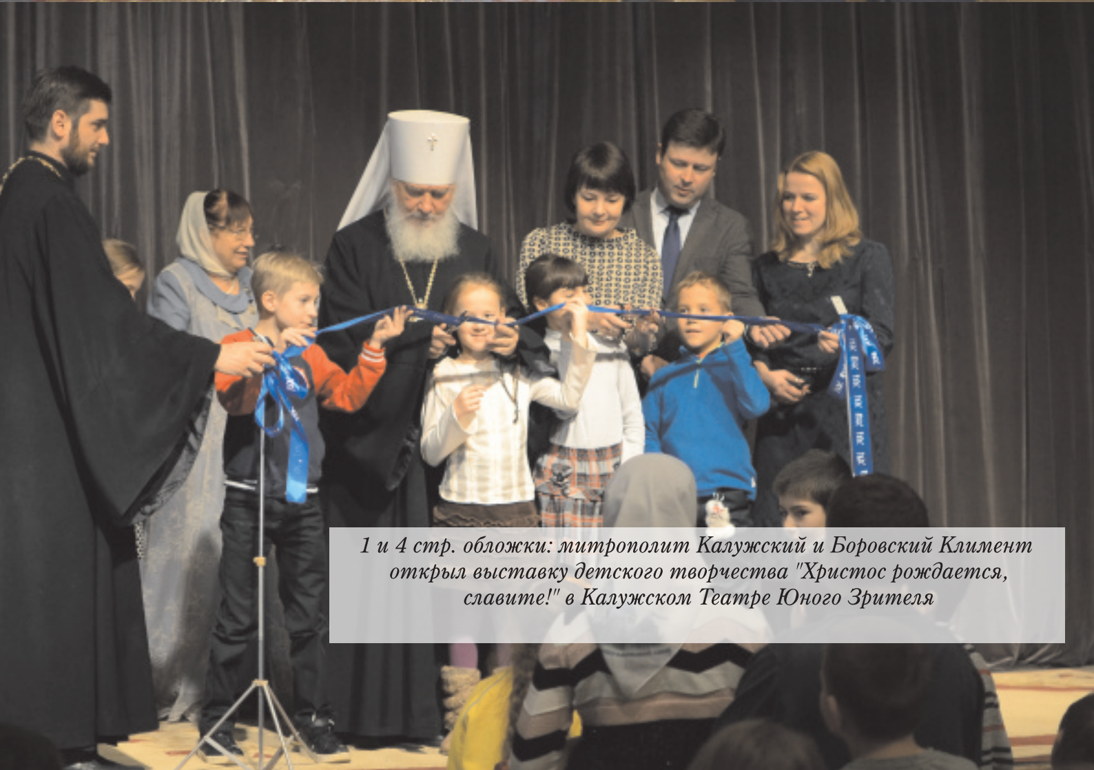
1 и 4 стр. обложки: митрополит Калужский и Боровский Климент открыл выставку детского творчества "Христос рождается, славите!" в Калужском Театре Юного Зрителя