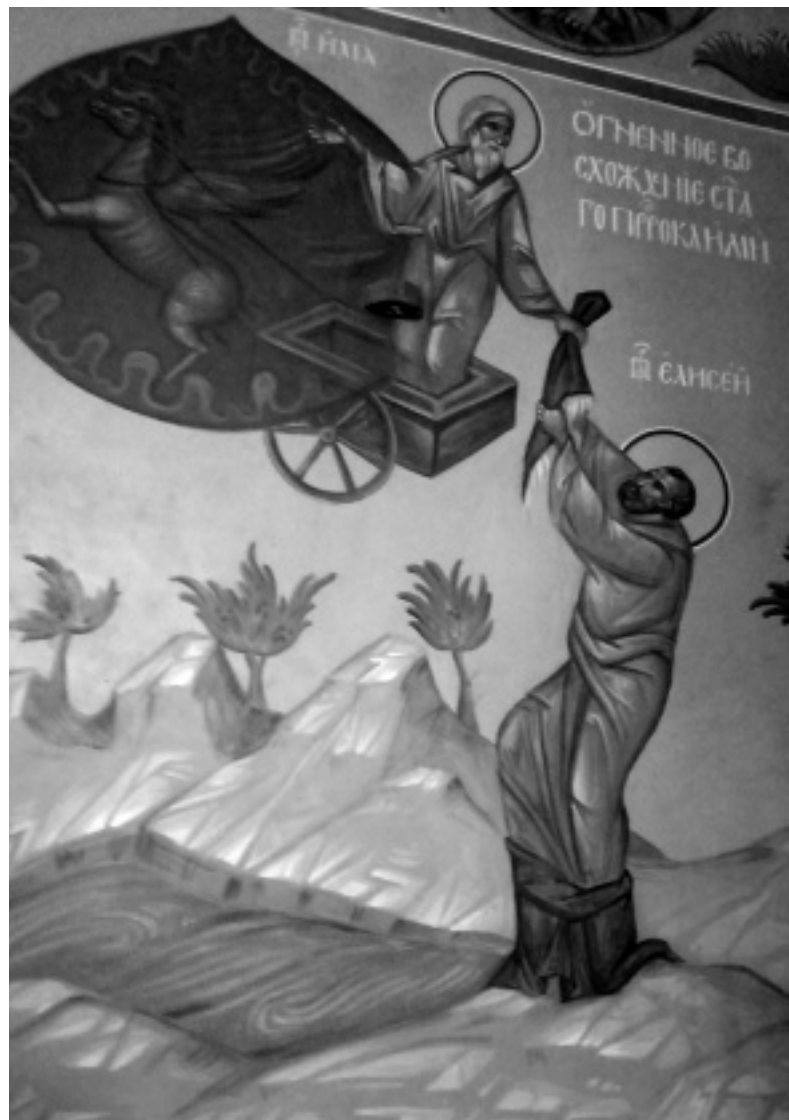
Вознесение пророка Или

Елисей идет дальше и ударяет этой милотью по воде, и воды Иордана расступаются, он посуху переходит Иордан, как Илия, и так понимает, что Бог его услышал, и он теперь пророк вместо Или, получил великую благодать от Бога. С милотью Или он не расставался всю свою жизнь. 4-я книга Царств передает нам