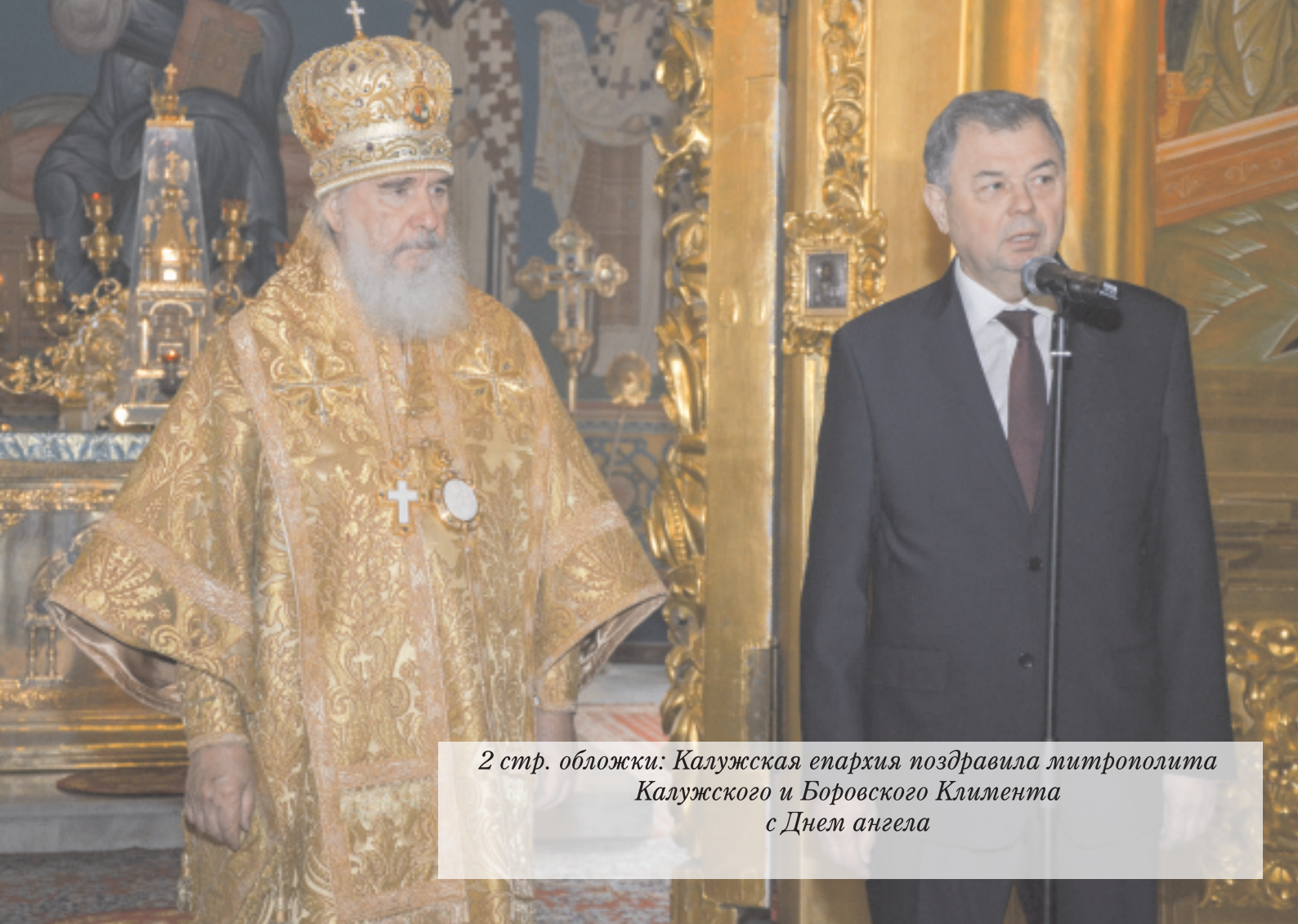
2 стр. обложки: Калужская епархия поздравила митрополита Калужского и Боровского Климента с Днем ангела