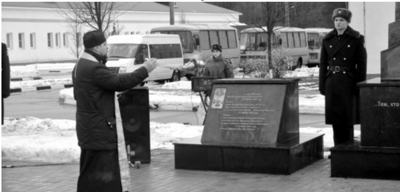
Торжественная церемония открытия мемориала памяти военнослужащих ермолинского авиаполка, погибших при исполнении воинского долга