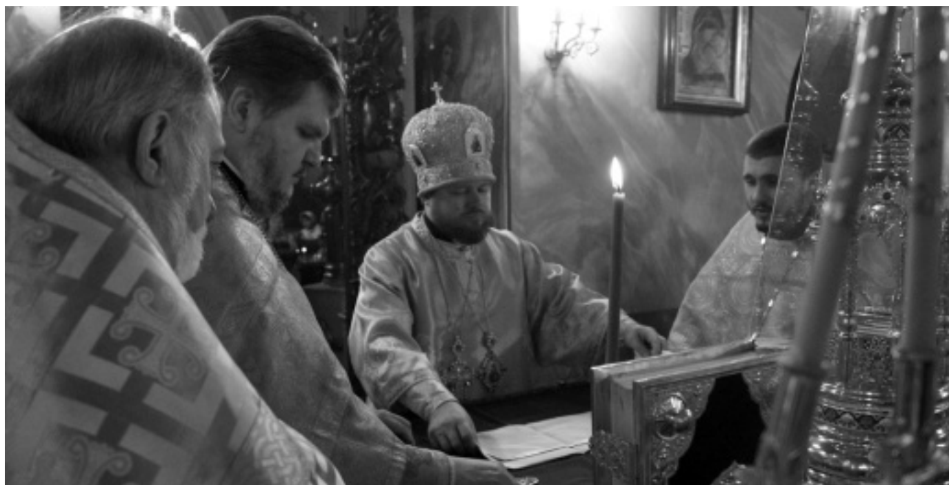
Божественная литургия в Свято-Никольском храме г. Калуги

В своей проповеди батюшка сказал: «...Святой Андрей назван Первозванным, потому что был призван первым из апостолов и учеников Иисуса Христа. До последнего дня земного пути Спасителя следовал за Ним. После крестной смерти Господа святой Андрей стал свидетелем воскресения и вознесения Христова. В день Пятидесятницы в Иерусалиме произошло чудо сошествия Святого Духа в виде огненных языков на апостолов. Так, вдохновляемые Духом Божиим, апостолы