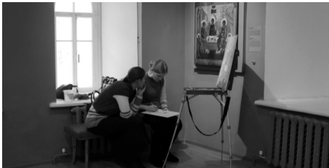
Выездная практика студентов иконописного отделения Калужского духовного училища

Практика будет проходить в музеях Ярославля и Великого Новгорода, имеющих ценные коллекции древних икон.