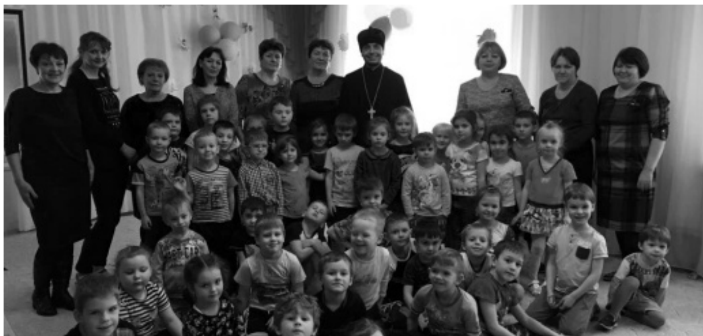
Беседа с воспитанниками детского сада «Аленушка» г. Малоярославца