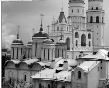
И ТАМ БЫЛ...

учреждении книжного магазина даже слегка кружится голова. Здесь, в построенном 12 лет назад на средства фонда имени Александра Солженицына здании, проходил круглый стол, посвящённый 137-летию одного из известных православных писателей — Ивана Шмелёва.