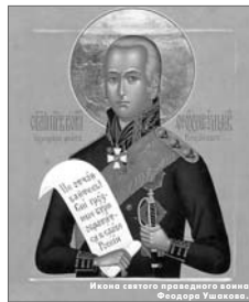
Икона святого праведного воина Фёдора Ушакова.

И при всём при этом «...благодарение Богу, при всех означенных боях с непри-