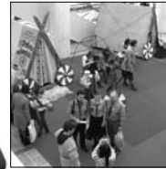
Участников ожидало много сюрпризов, даже показ православной моды.

создать общий Интернет-портал, о котором мы и говорим уже 10 лет, но никто ещё за его разработку не взялся. Так что пока нашим русским православным движениям приходится вот так вот изредка собираться и делиться опытом. Но ещё более остро была поставлена другая проблема. Православным молодёжным движениям необходимо помощь со стороны старших отцов в работе с молодёжью. Для КИМД это, действительно, очень актуальная проблема. Ведь до сих пор у нас нет даже своего штаба (около 3-х лет). А так хочется видеть активную молодёжь на наших собраниях, расширять ряды нашего объединения! Но приглашать некуда. Сейчас КИМД начало активную волонтерскую деятельность по оказанию помощи детям-сиротам, и к нам часто поступают по-