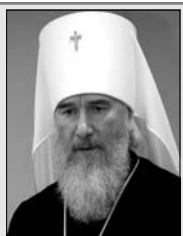
Митрополит Клузьский и Боровский КЛИМЕНТ. Специально для «Веры Молодых».

Образности телесного поста для разных людей могут отличаться. Церковь делает послабления в посте для больных, детей, пожилых людей, но это не значит, что они освобождаются от поста духовного. Как и все верующие, они должны молиться и стараться исправлять свою жизнь: отказываться от зла в своих мыслях, словах, поступках и делать добро. О сути поста напоминают молитвы, которые звучат в эти дни за богослужением, в которых пост называется «матерью целомудрия», «обличением грехов», «временем покаяния».