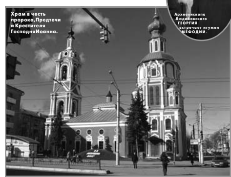
Храм в честь пророка Предтечи и Крестителя Господня Иоанна.