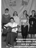
Стрелковоиспытания. «Как здорово, что все мы здесь сегодня собрались!»

XVII Международные Рождественские образовательные чтения «Наука, образование, культура духовно-нравственные основы интуитивизма» прошли в Москве с 13 по 17 февраля 2009.