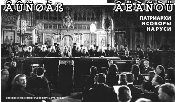
Заседание Поместного Собора РПЦ 1917 года.