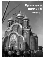
Крест уже почтinha места.