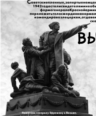
Памятник генералу Ефремову в Вязьме.