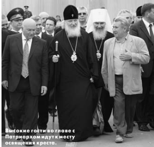
Видноки готили в главе с Патриархом идути месту освящения креста.