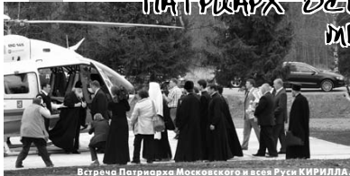
Встреча Патриарха Московского и всея Руси КИРИЛЛА.