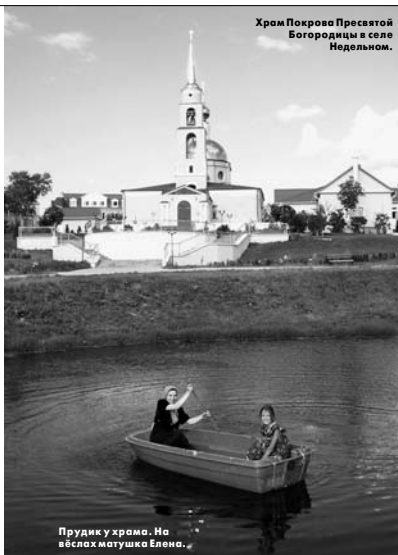
Храм Покрова Пресвятой Богородицы в селе Недельном.