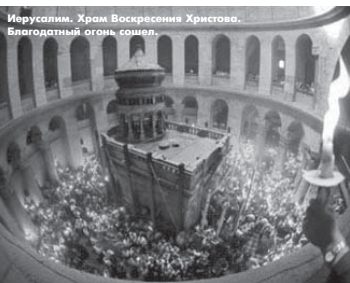
Иерусалим. Храм Воскресения Христова. Благодатный огонь сошел.

Православный не ищет на земле рая. На этой земле Христа распяли. Православный радостен и светел, в день Пасхи он вновь чувствует, что дом его не здесь, что есть иная жизнь, что мы пока в гостях и нашего нам еще не дали. Митрополит Вениамин (Федченков) в одной из проповедей на Пасху вспоминал Колумба и его команду.