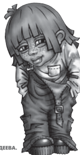
Рисунок Андрея ФАНДЕВА.

ето как будто один большой праздник. Феерически расцветает все: деревья, кусты, травы, и везде тополиный пух – как салют. Нарядно одетые выпускники, навсегда забросив под шкаф учебники, празднично шагают по мостовым. Впереди у них все, что только можно представить. Молодость, любовь, счастье, свобода. Еще, конечно, будет семья, дети, дом, работа, работа... Но об этом, последнем, сейчас не думается. Обо всем трудном, тяжелом успеется подумать потом, когда они станут взрослыми и скучными. А впереди последнее лето детства. Наверное, так все и должно быть: «Блажен, кто смолоду был молод...» Только бывает и так, что пытаются иные растянуть свое лето детства до самой пенсии. Забывая вторую строку из стихотворения поэта: «Блажен, кто вовремя созрел». О таких смотрите стр. 7.