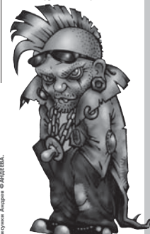
А ТЕПЕРЬ СМЯИ И СПУШАЙ