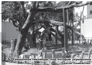
Священник сикомора, под которой укрывалось Святое Семейство.

Самая южная точка останков святых странников — Теир аль-Мукаррак («Сожаженный монастырь»). Монастырь IV века в честь Богородицы построен над широкой пещерой, приоткрытой изгнанников 2000 лет назад. Географически это примерно в среднем районе Египта. Здесь Святое Семейство прожило шесть месяцев и десять дней. Древнееврейские надписи на плите скалы свидетельствуют о самой длинной остановке Святого семейства в скитаниях по Египту. Именно здесь было возведено Иосифом возмездием Семейства в Палестину: «Встань, возьми Младенца и Матерю Его и иди в землю Израилеву, ибо умерли искание души Младенца» (Евангелие от Матфея, 2, 20).