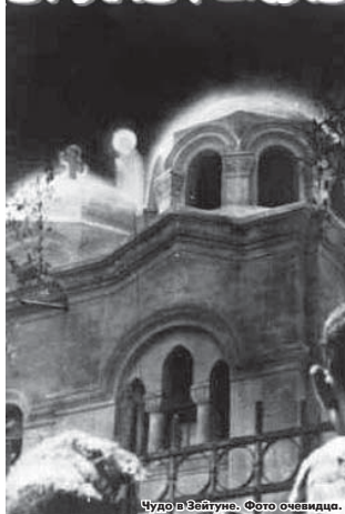
Чудо в Зейтуне.