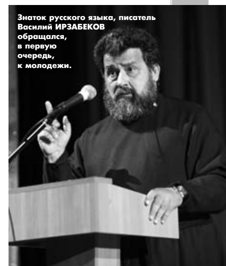
Знарок русского языка, писатель Василий ИРЗАБЕКОВ обращался, в первую очередь, к молодежи.