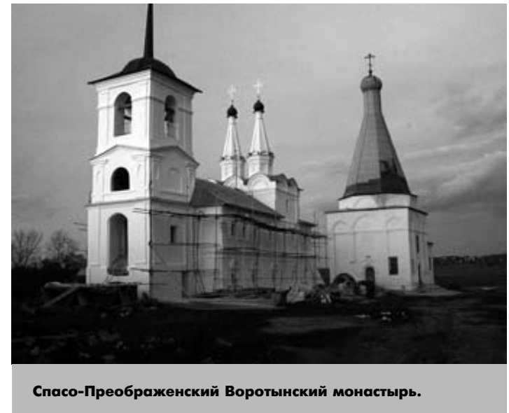
Спасо-Преображенский Воротыньский монастырь.