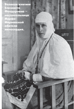
Великая княгиня Елизавета Федоровна — настоятельница Марфо-Марининской обители милосердия.

Конечно, о полном восстановлении святого места в его прежнем облике можно только мечтать. Но пусть пока там возвышется памятный крест, чтобы дети и молодежь, приезжающие отдохнуть в эти чистые, заповедные края, могли соприкоснуться с историческим прошлым этого места.