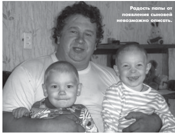
Родить папы от появления сыночек невозможно опомнись.