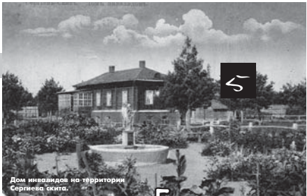
Дом инвалидов на территории Сергиева скита.

В 1981 году Великая княгиня Елизавета Федоровна была прославлена как святая Русской Православной Церковью Зарубежом. В 1992 году это произошло и в России. Елизавета Федоровна всегда вернулась к нам — как святая заступница своей новой, так горячо ею любимой родины.