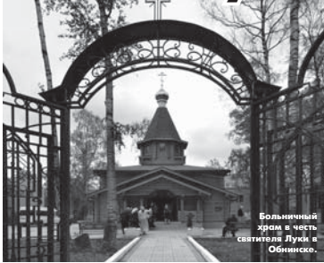
Большинственный храм в честь святителя Луки в Обнинске.

четверо стали меликами, пойдя по стопам отца. Он остро переживает, что дети (двоих из них он сам прооперировал) стыдятся отцовского рая, не поздравляли его ни с Рождеством, ни с Пасхой.