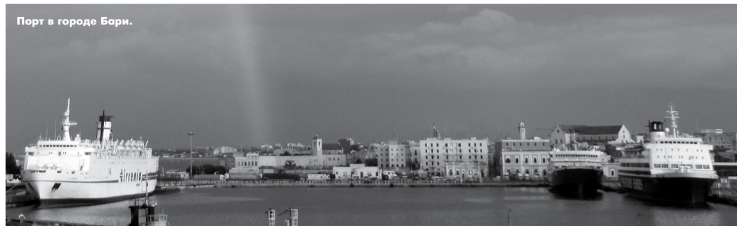
Порт в городе Бари.