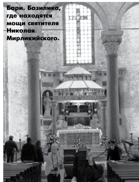
Бари. Базилика, где находятся мощи святого Николая Мирликийского.