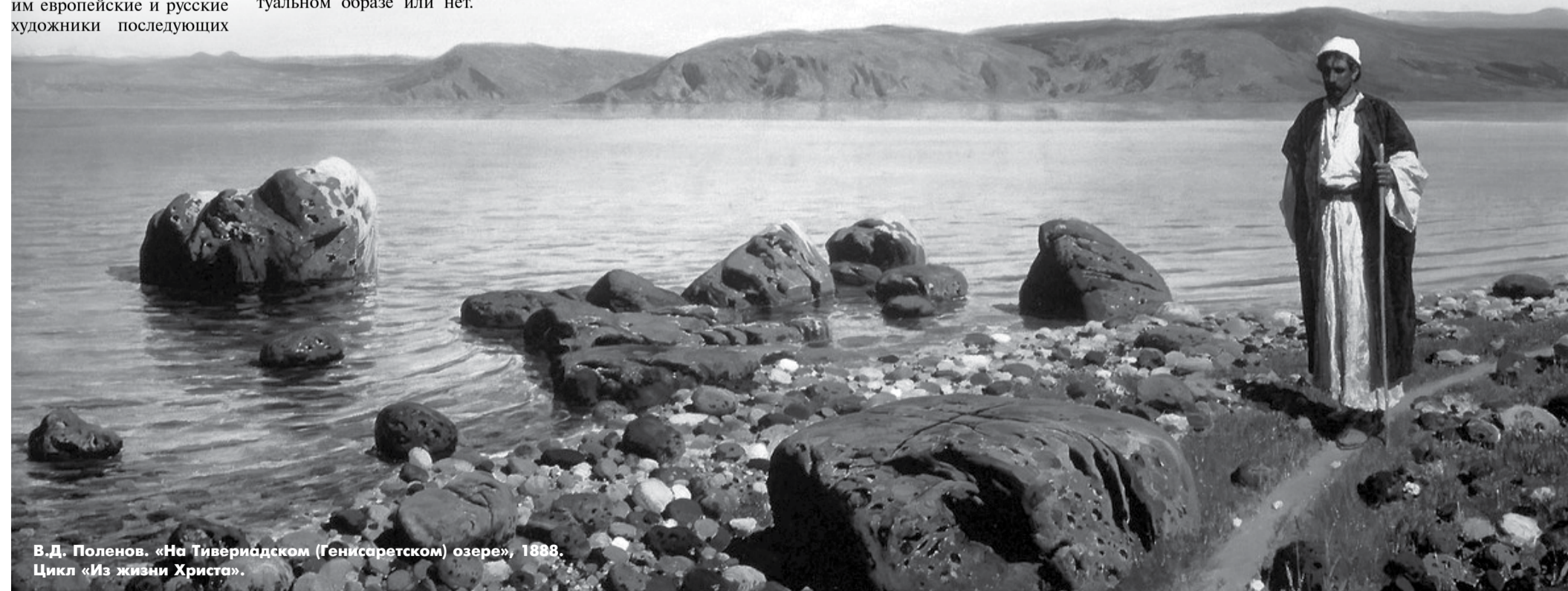
В.Д. Поленов. «На Тиверийском (Генисаретском) озере», 1888. Цикл «Из жизни Христа».