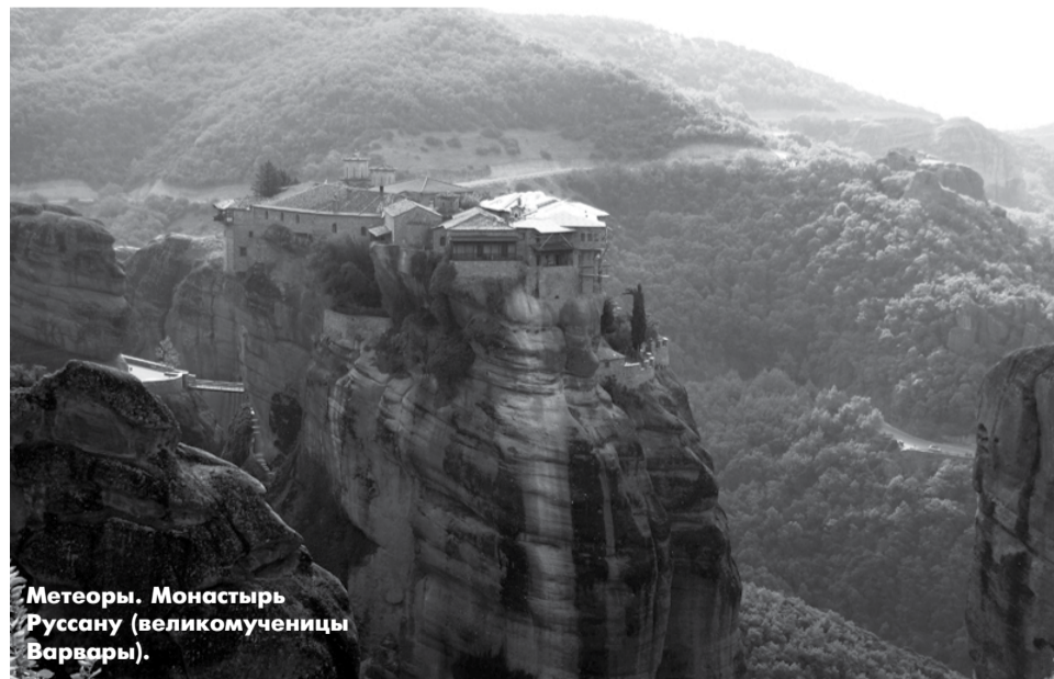
Метеоры. Монастырь Руссану (великомученицы Варвары).