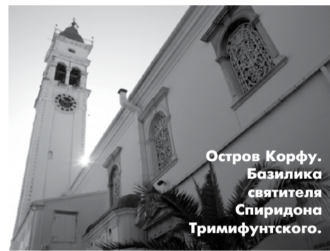
Остров Корфу. Базилика святого Спиридона Тримифунтского.