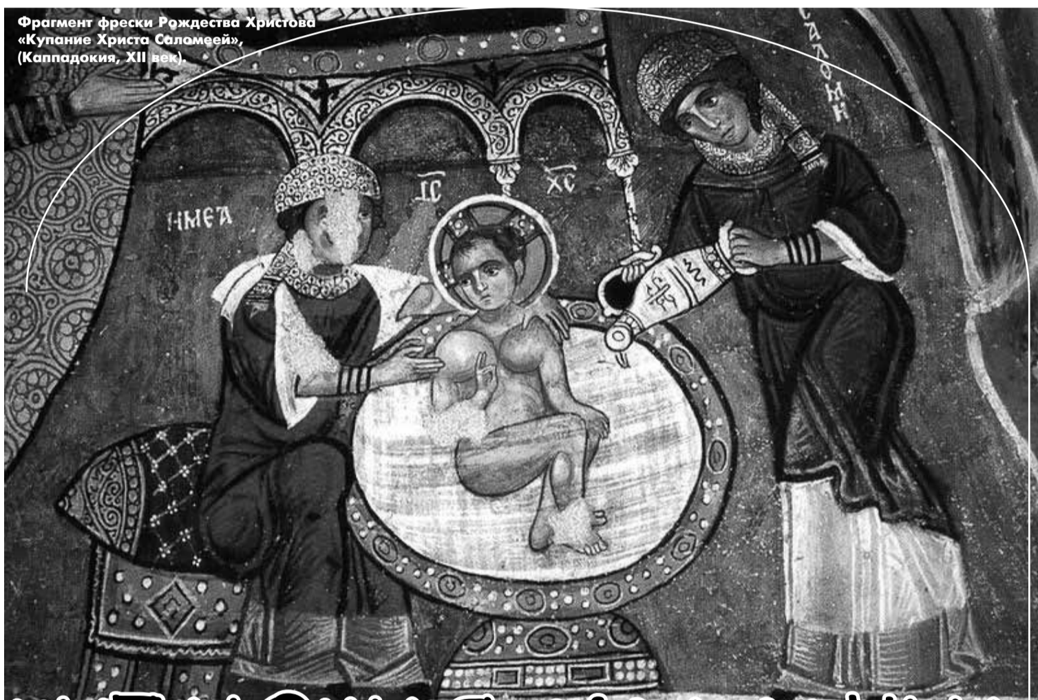
Фрагмент фрески Рождества Христова «Купание Христа Саломеей», (Каппадокия, XII век).

Узнаём себя в героях Хаксли и Оруэлла. стр. 8