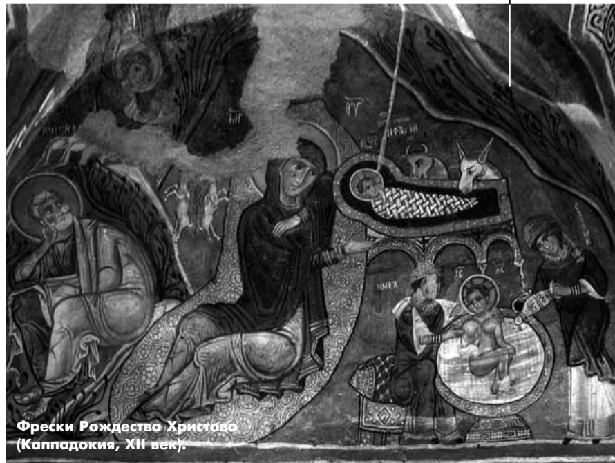
Фрески Рождества Христова (Каппадокия, XII век).

ПОЧЕМУ ПОВИТУХУ САЛОМЕЮ ИЗОБРАЖАЮТ НА ИКОНАХ РОЖДЕСТВА ХРИСТОВА?