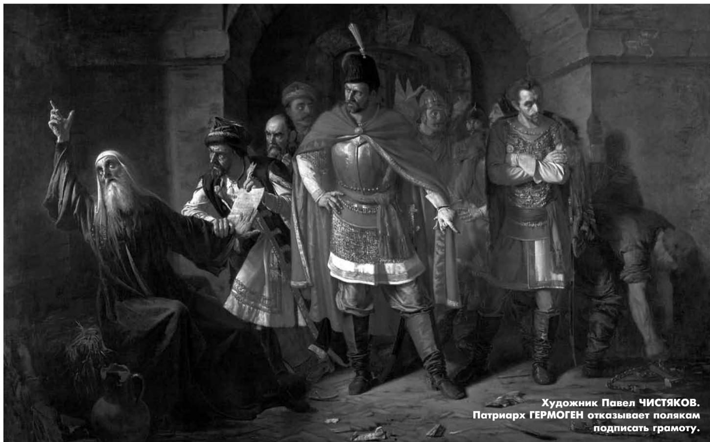
Художник Павел ЧИСТЯКОВ. Патриарх ГЕРМОГЕН отказывает полякам подписать грамоту.