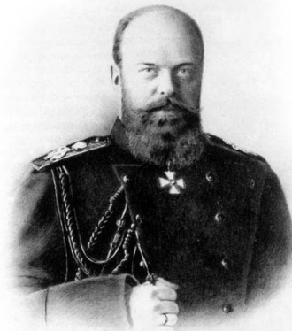
Император Александр III, Царь-Миротворец. Августейший основатель Великого Сибирского пути.

Но в итоге великая стройка завершилась. 9000 километров самой длинной железной дороги в мире стальной нитью надежно скрепили страну. Без нее Россия могла потерять Сибирь и Дальний Восток. И за то, что она сохранила их по сей день, мы должны, в числе первых, благодарить того, кто 122 года назад, 31 мая 1891 года, лично заложил первое звено Транссиба.