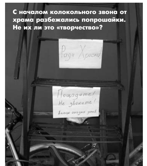
С началом колокольного звона от храма разбежались попрошайки. Не их ли это «творчество»?