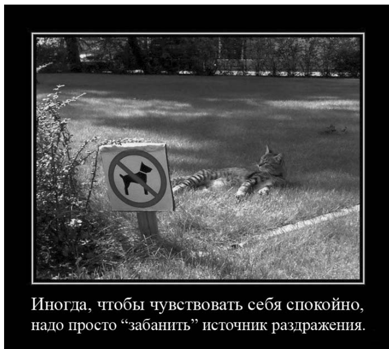
Иногда, чтобы чувствовать себя спокойно, надо просто «забанить» источник раздражения.

В пригородах Стокгольма целую неделю бунтовали сомалийцы, турки и арабы... В душу вползает леденящая уверенность, что этот мир сходит с ума. Что с нами происходит? Куда мы движемся? Чего ждать в будущем? Попробуем разобраться.