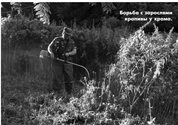
Борьба с зарослями крапивы у храма.