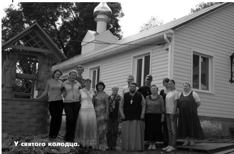
У святого колодца.