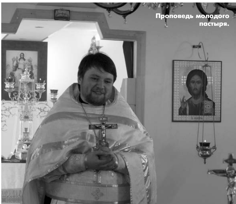
Проповедь молодого пастыря.