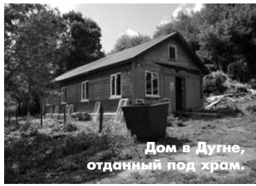
Дом в Дугне, отданный под храм.