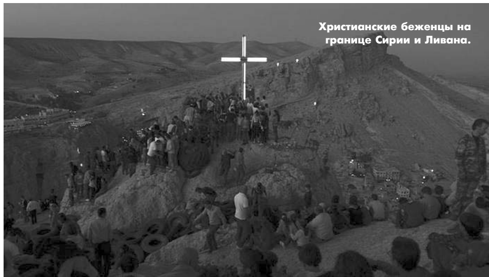
Христианские беженцы на границе Сирии и Ливана.

Вряд ли удастся. Древняя сирийская земля помнит, как на пути в Дамаск гонитель Церкви иудей Савл превратился в апостола Павла. И что именно в Антиохии ученики и последователи Иисуса из Назарета впервые стали называть себя христианами.