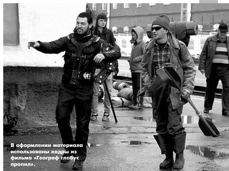
В оформлении материала использованы кадры из фильма «Географ глобус пропил».