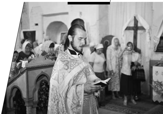
Праздничная служба. Шаровкин монастырь, 2013 год.

В июле месяце к нам приезжал даже целый детский православный лагерь из Москвы. Около ста человек в возрасте от восьми до шестнадцати лет, со священником. Прежде они два года подряд отдыхали возле Клыковского монастыря, а на этот раз пере-