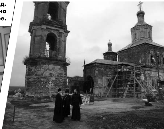
Визит митрополита Калужского и Боровского Климента в храм села Ильинское. Ноябрь, 2013 год.

Сейчас от монастырских построек почти ничего не осталось. Сама церковь, как я уже говорил, очень старая: кровля в плачевном состоянии, после дождя все течет, кирпичи из стен буквально на голову сыплются. Но так как этот храм попутно еще и памятник культуры федерального значения, то мы не можем без особого разрешения даже заменить этот самый выпавший кирпичик!