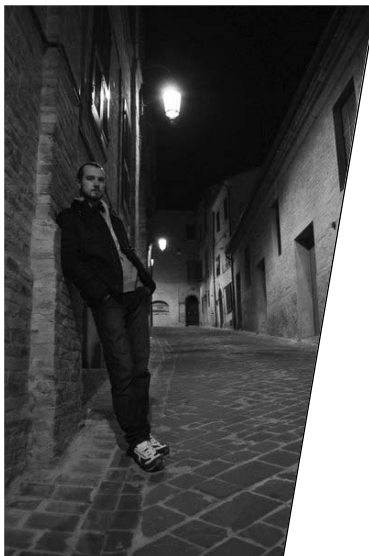
На гастролях в Италии, 2011 год.