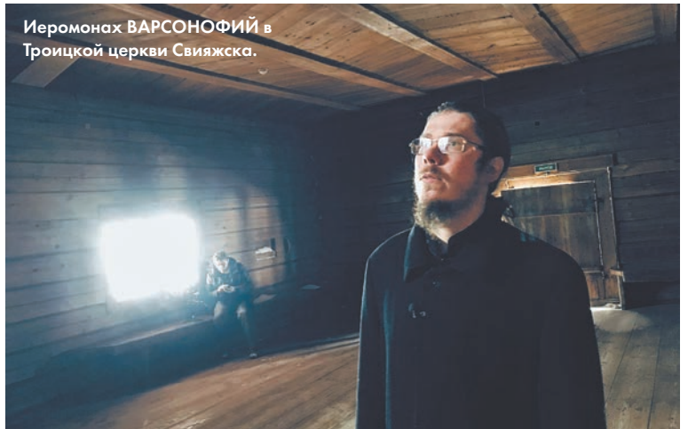
Иеромонах ВАРСОНОФИЙ в Троицкой церкви Свияжска.