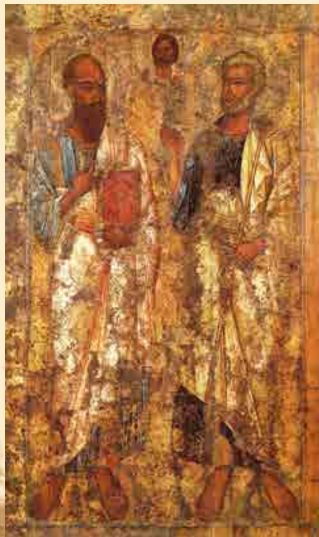
Апостолы Пётр и Павел. Икона. Новгород. XI век

В своих непрерывных трудах апостол Павел переносил неисчислимые скорби. В одном из Посланий он признаётся, что: «Много раз был в путешествиях, в опасностях на реках, в опасностях от разбойников, в опасностях от единоплеменников, в опасностях от язычников, в опасностях в городе, в опасностях в пустыне, в опасностях на море, в опасностях