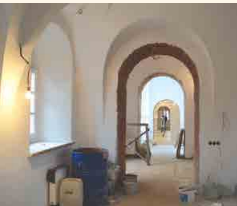
Ведутся работы по внутренней отделке нового здания