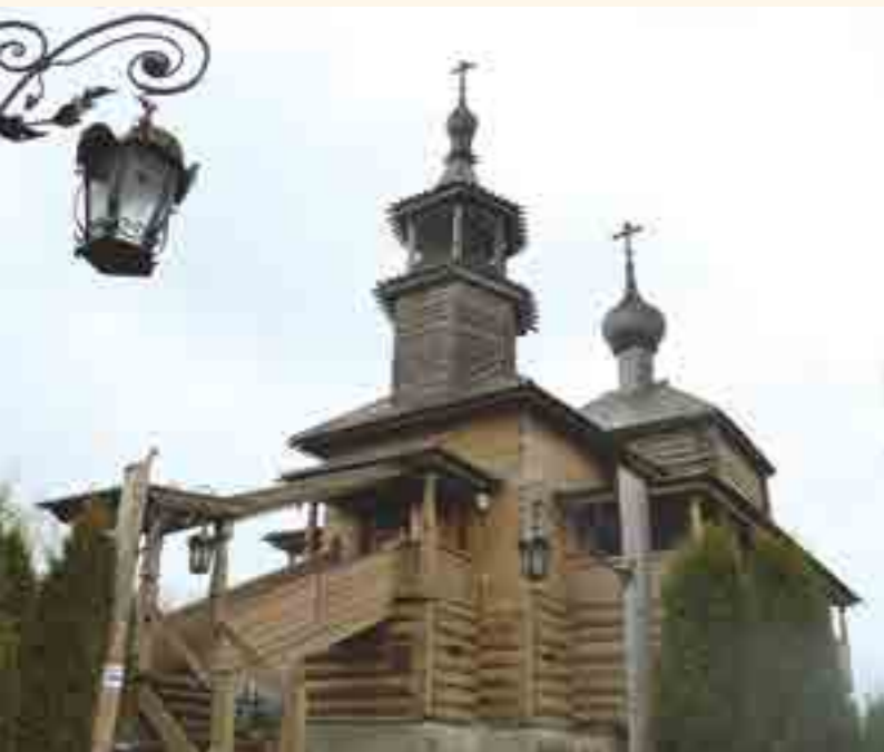
Храм Покрова Пресвятой Богородицы в городе Боровске