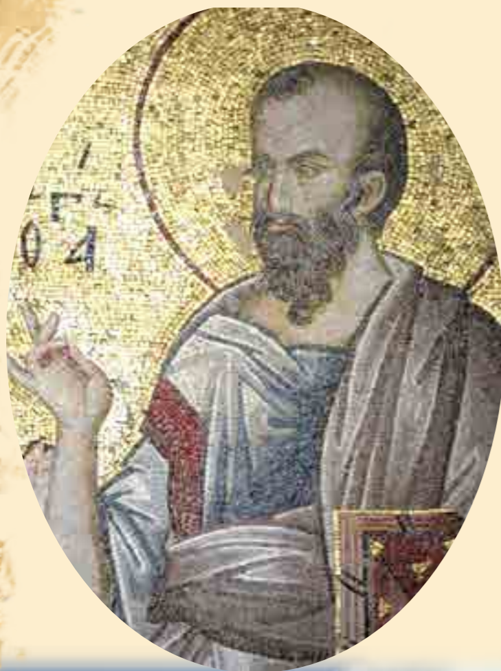
Апостол Павел. Мозаика. Византия. XIV век

ператора Нерона, жаждавшего отомстить апостолу за гибель своего друга Симона-волхва и за обращение ко Христу любимых жён, святой апостол Пётр в 67 г. был казнён.