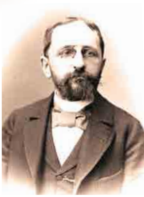
Гюстав Лансон. Французский историк, литературовед