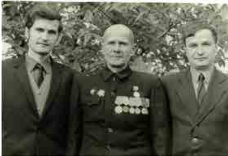
Слева направо: сын Виталий, дедушка и сын Анатолий

остановить немцев, которые, разбив половину Воронежского фронта, шли на Курск с юга. Две свежие армии остановили фашистов в самых кровопролитных боях под Прохоровкой, Яковлево, Верховень и отбросили их до рубежей Харькова. Одновременно артполки 76-миллиметровых пушек, зенитки, 37-миллиметровые орудия, минометы были выставлены на прямую наводку – небывалое, но вынужденное для артиллеристов явление и тактически оправданное.