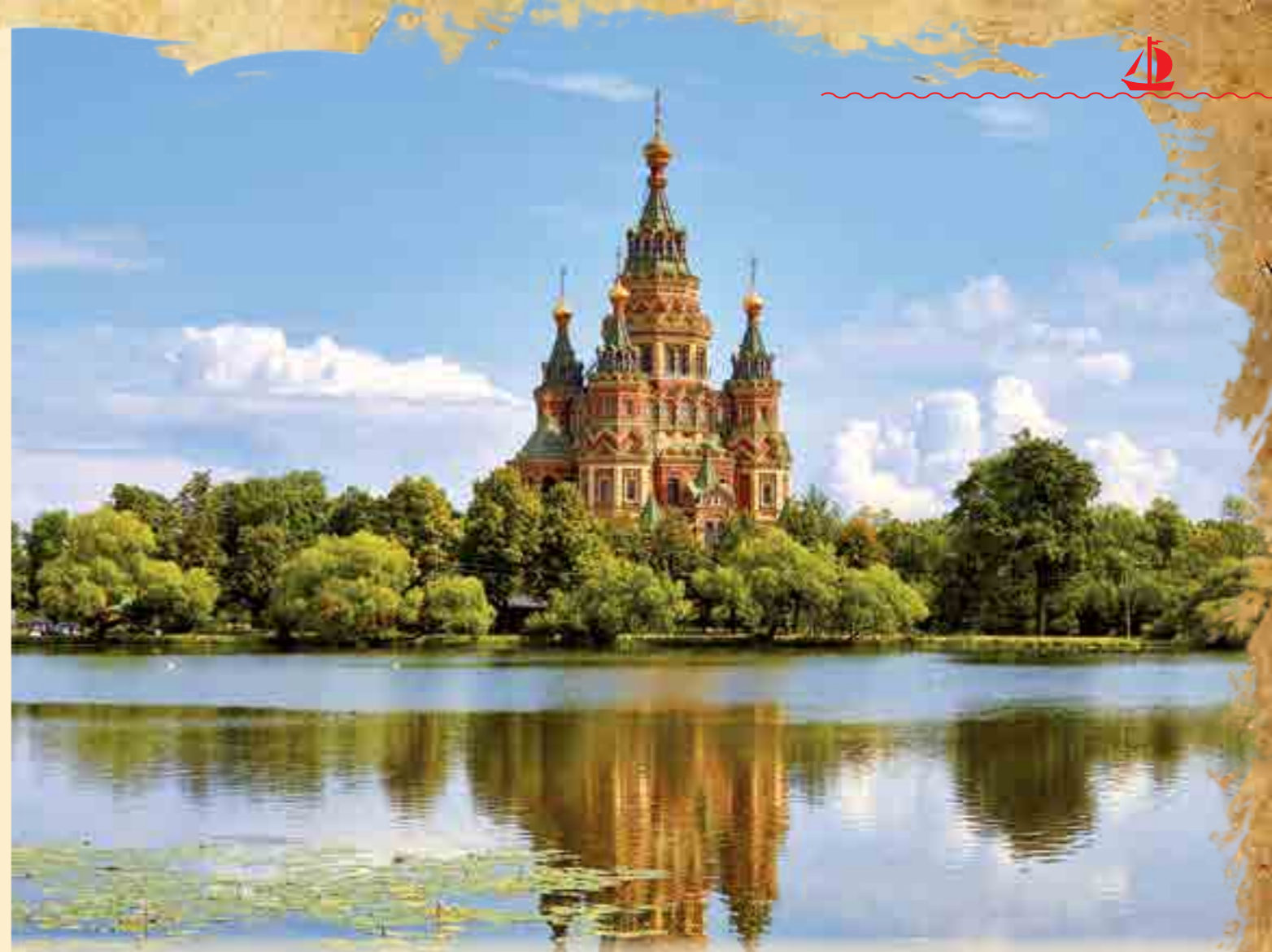
Собор Святых Петра и Павла. Петергоф. XIX век

горячки (Мк. 1:29–31). Христос удостоил Петра быть свидетелем выдающихся евангельских событий: Преображения Христова на Фаворе (Мф. 17:1–9; Лк. 9:28–36), воскрешения дочери Иаира (Лк. 8:41–56), молитвенного бдения в Гефсиманском саду перед Распятием (Мф. 26:37–41). Апостол Пётр был единственным защищавшим Господа от тех, кто пришел предать Учителя на страдание и смерть. Впав в искушение, он трижды отрёкся от Христа, но впоследствии глубоким слёзным покаянием загладил свою вину. Именно ему Спаситель доверил пасти Свое стадо овец словесных. После Вознесения Господа на небо апостол Пётр посетил множество стран, пламенно и дерзновенно проповедуя Христа Воскресшего, приводя к Господу тысячи людей (Деян. 2:41; 4:4). По его слову мёртвые воскресали, хромые начинали ходить, расслабленные исцелялись. Больные получали благодатную помощь даже от прикосновения к его тени (Деян. 5:15). Верный