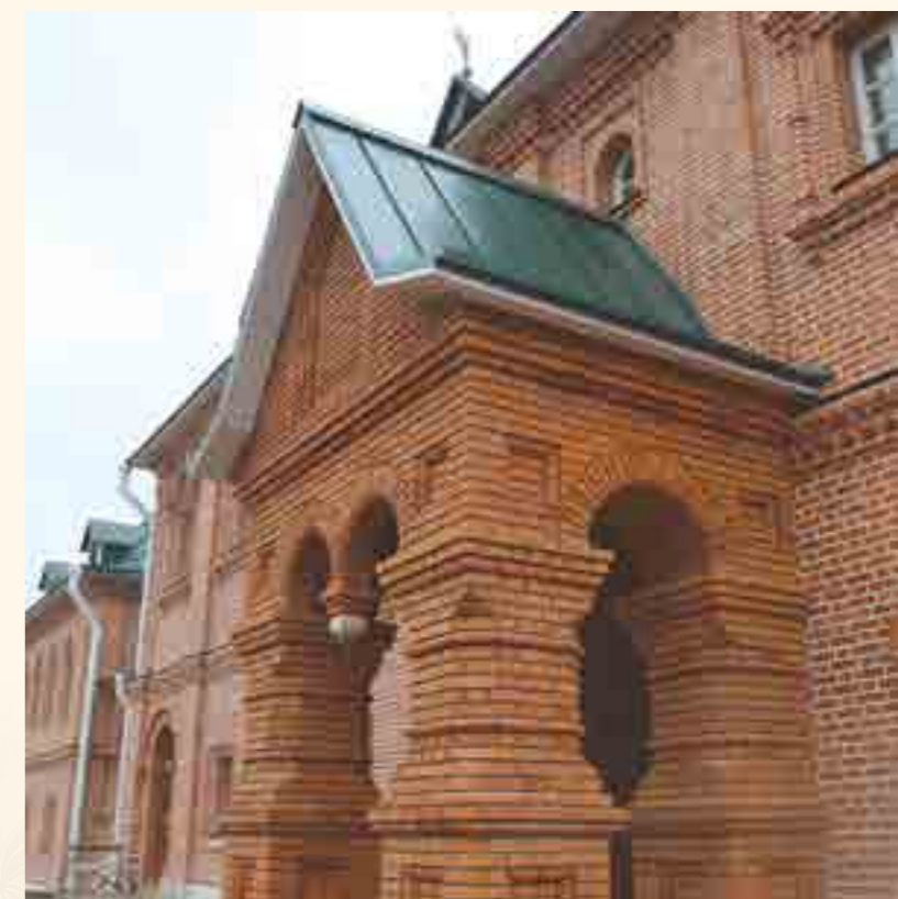
Крыльцо нового здания