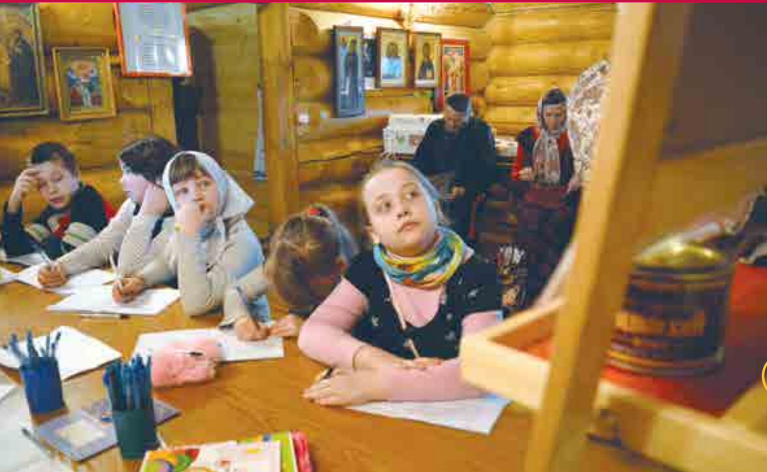
Занятия проходят в подклете храма