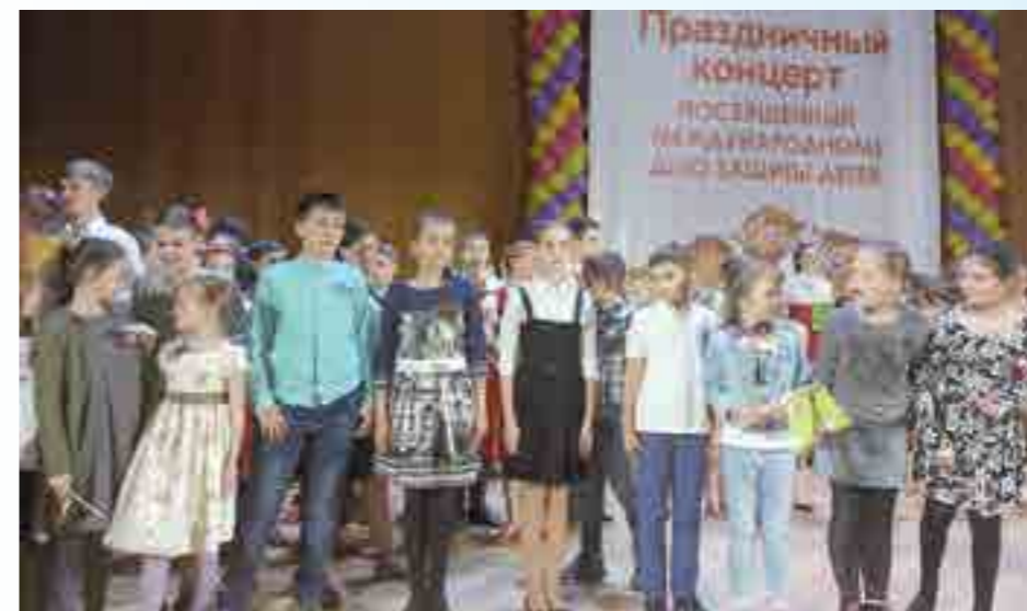
Победители конкурса «Святые заступники Руси» на праздничном концерте в Зале Церковных Соборов Храма Христа Спасителя. 1 июня 2017 года