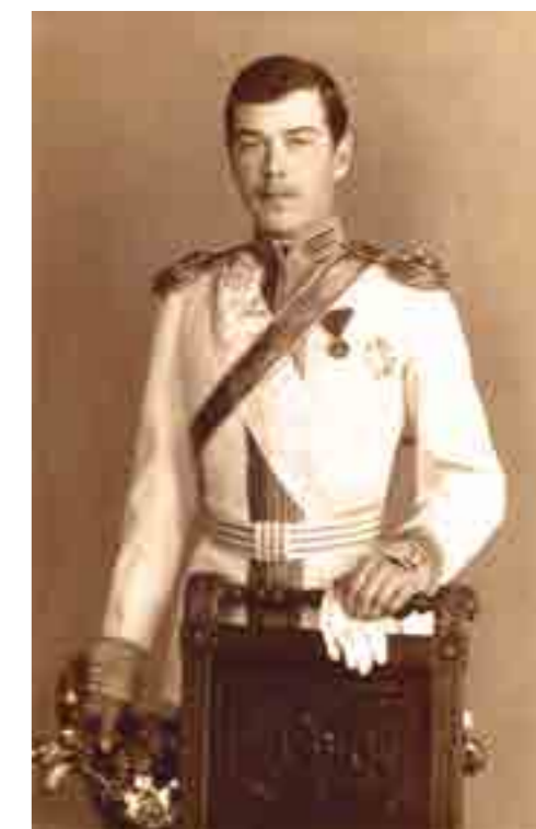
Цесаревич Николай II. 1890 год

Вообще ложь не может укрыться от внимательного взгляда, потому что зачастую сама разоблачает себя. Вот, например, каким образом один из авторов ходячий миф «об ограниченных умственных способностях» государя Николая II рас-