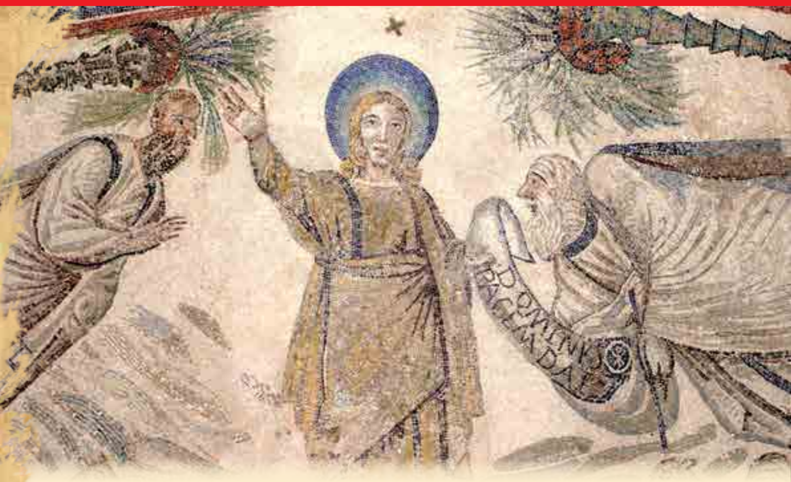
Христос даёт закон апостолу Павлу и ключи апостолу Петру. Мозаика. Италия. V век

добно тому, как одна тень апостола Петра исцеляла людей, слово его исцеляло больных (Деян. 14:10; 16:18), поразило слепотой волшебника (Деян. 13:11), воскресило мёртвого (Деян. 20:9–12), даже вещи святого апостола были чудодейственны. Господь удостоил Своего верного ученика восхищения до третьего неба. По собственному признанию святого апостола Павла, он «был восхищен в рай и слышал неизреченные слова, которых человеку нельзя пересказать» (2 Кор. 12:2–4).