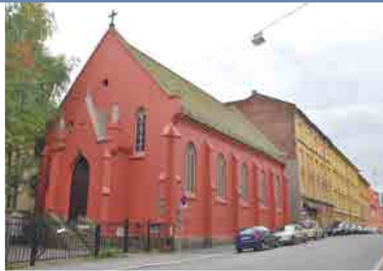
Храм Благовещения Богородицы на Thor Olsensgate. Осло