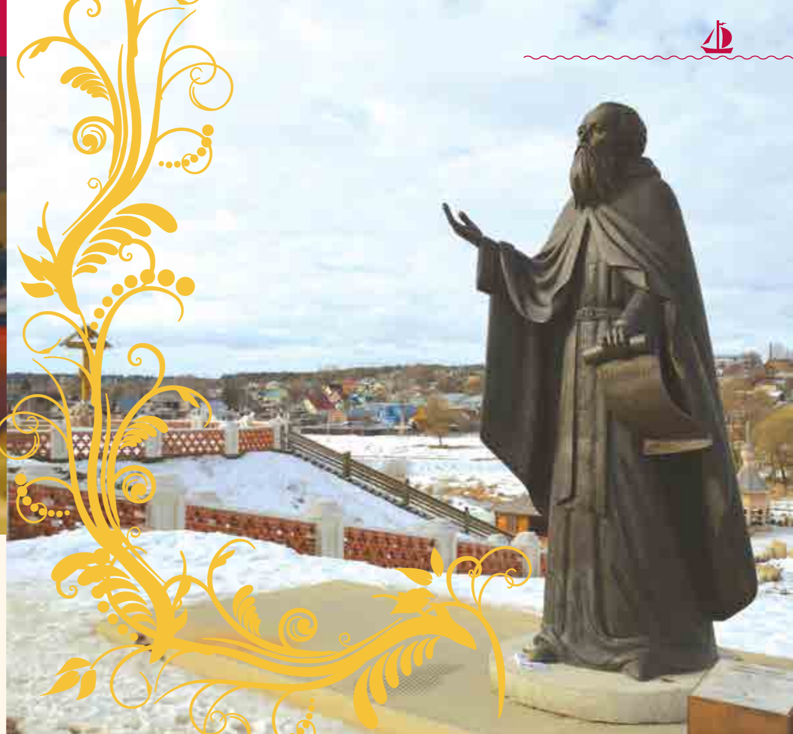
Памятник преподобному Пафнутию Боровскому, всея России чудотворцу

В ближайшее время завершится не только строительство нового здания, но и благоустройство территории вокруг установленного неподалёку памятника преподобному Пафнутию Боровскому. Напомним юным читателям «Кораблика», что нынешний храм стоит на месте, где когда-то находился Высоко-Покровский Боровский монастырь, в который пришёл молодой отрок Парфений и принял постриг с именем Пафнутий, здесь же он стал игуменом обители. В 1444 году игумен Пафнутий покинул