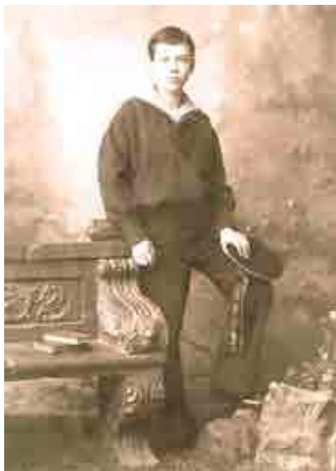
Цесаревич Николай Александрович. 1881 год

мание его было рассеянно, мысли витали в облаках... Послушный сын, Ники не отказывался учиться, но его инертность приводила его педагогов в замешательство. Кстати говоря, последние получили строгий приказ не докучать великому князю, проверяя его знания. Они читали ему урок, но не требовали после этого пересказывать его и уж тем более не устраивали ему экзаменов» 4 . Перед нашим взором возникает образ эта-