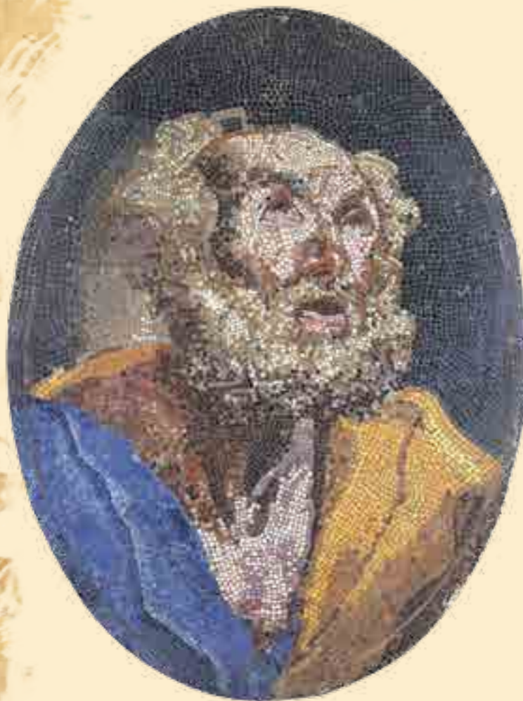
Апостол Пётр (плачущий). Джованни Ланфранко. Мозаика. Санкт-Петербург. 1755 год

имел семью: жену и двоих детей, тещу и жил до поры как все. Ко Христу его привёл младший брат Андрей. Встреча с Господом поразила его.