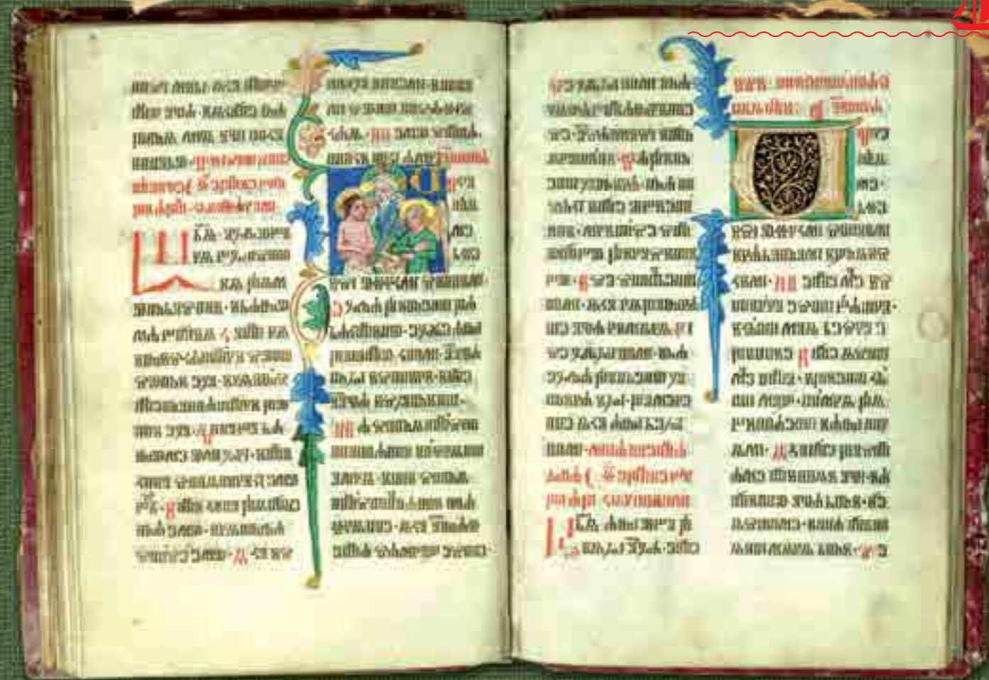
Евангелие. 1395 год

между лжебратиями, в труде и в изнурении, часто в бдении, в голоде и в жажде, часто в посте, на стуже и в наготе» (2 Кор. 11:24–27). Все свои нужды и скорби святой апостол Павел переносил с великим смирением и слезами благодарности, он в любое время готов был умереть за имя Господа Иисуса (Деян. 21:13). Несмотря на непрерывные гонения, которые претерпевал апостол Павел, к нему испытывали великое уважение его современники, которые ещё при жизни считали его святым.