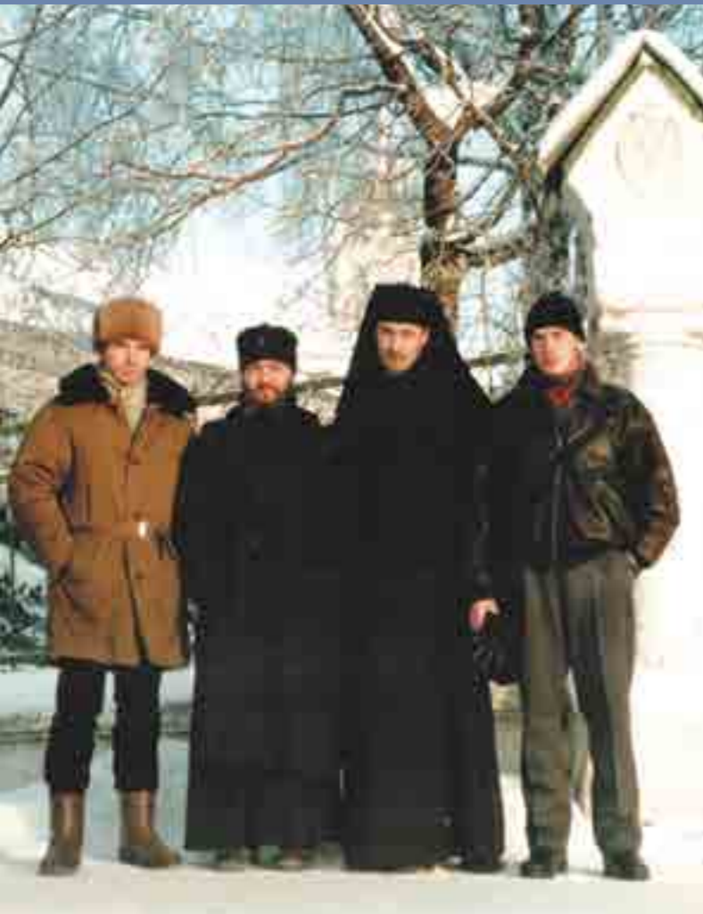
МДАиС. Декабрь 1996 года