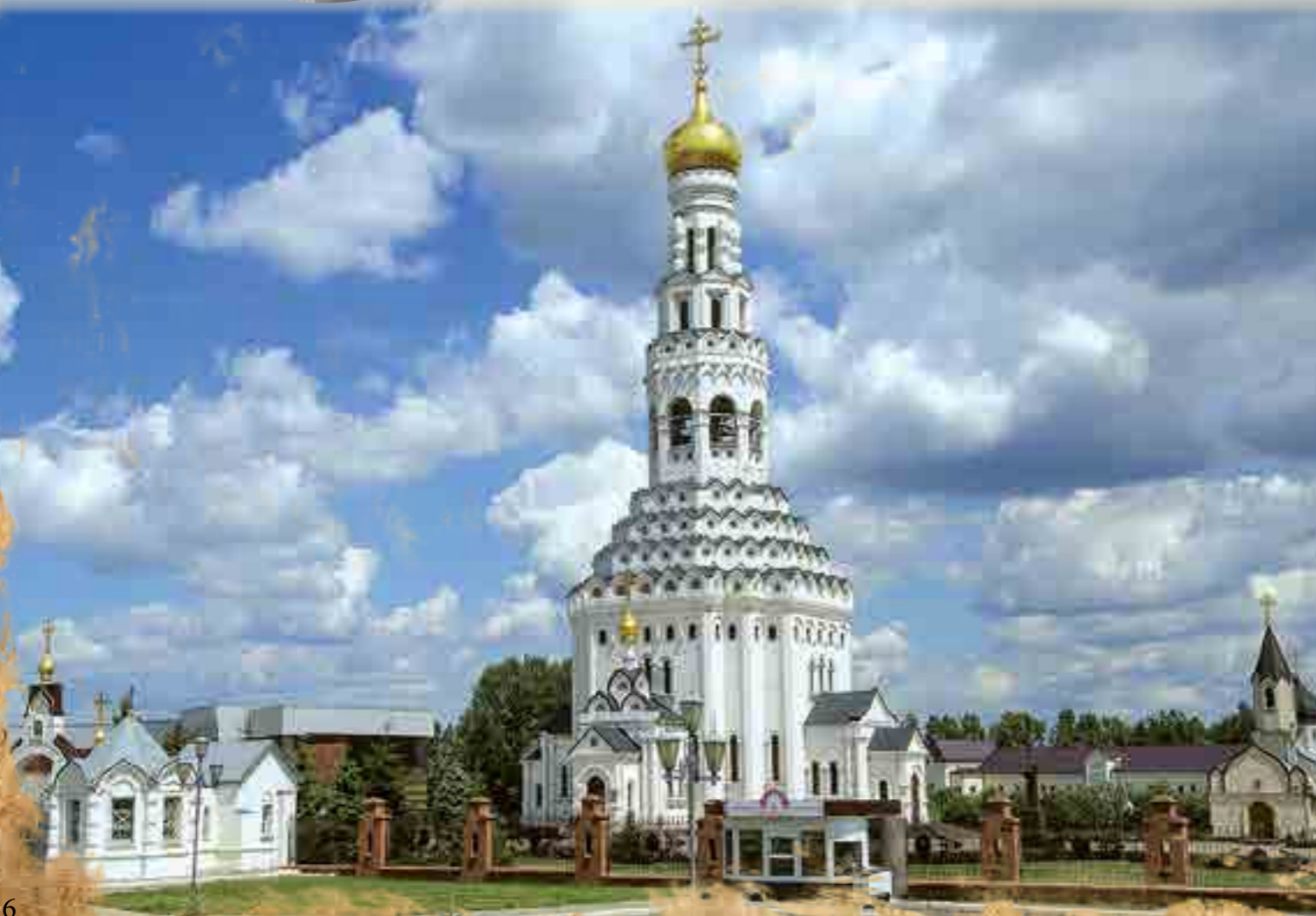
Храм Святых апостолов Петра и Павла в Прохоровке. 1995 год

Святой апостол Павел до своего призвания на апостольское служение назывался Савлом. Родился он в городе Тарсе от знатных родителей и имел права римского гражданства. Савл принадлежал к секте фарисеев, он, прозванный впоследствии «сосудом избранным», был поначалу истовым иудеем, ненавидящим христиан и их учение. Савл был свидетелем мученической смерти архидиакона Стефана, побито-