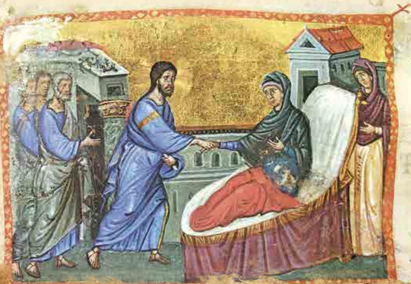
Исцеление Петровой тещи. Миниатюра. Византия. XIII век

Вскоре после первой встречи Господь Сам посетил дом Петра и исцелил его тещу от